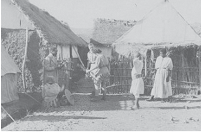
Mission Dakar–Djibouti (Abba Jérôme, M.L. et D.L.)

première mission en 1928–1929) et le Goğgam est la province dans laquelle se trouve D.L. et Louis-Gaston Roux au moment des événements de juin 1932.