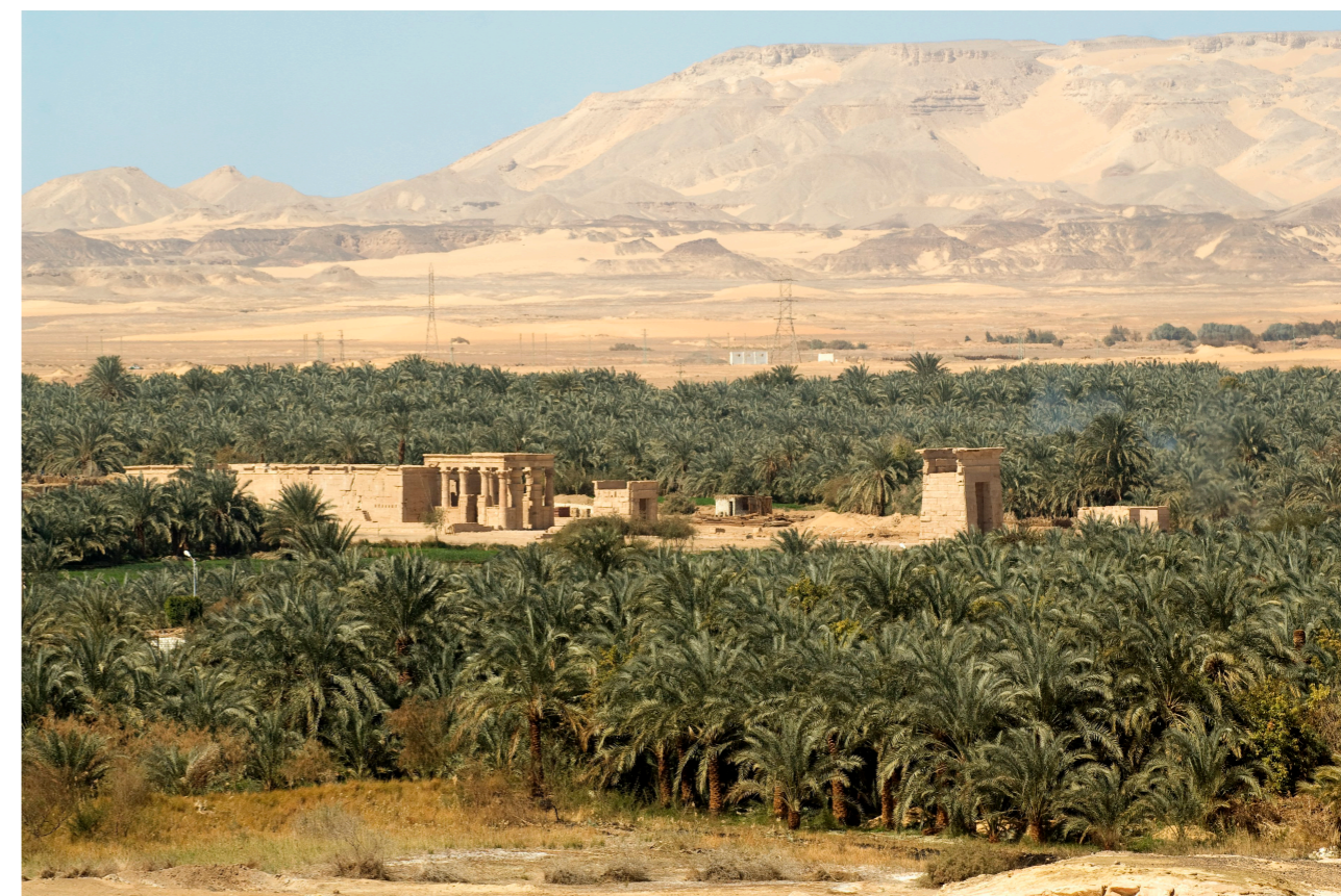
5.X L'oasis de Kharga et le temple d'Hibis