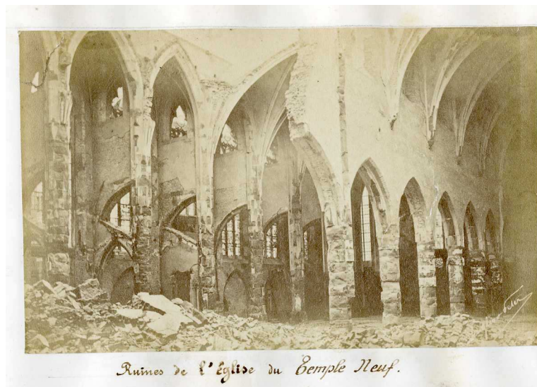
Ruines du Temple Neuf

Ce document est tout à fait exceptionnel en bien des points. Plus qu'un journal, il est une compilation documentaire conséquente. De plus, il traduit non seulement avec justesse des ressentis partagés mais aussi l'ambiance d'une ville assiégée et totalement isolée, à la merci de ses assiégeants. Au sortir de la guerre de 1870, Strasbourg est une ville martyre et au-delà de la perte de l'Alsace, le sort subi par Strasbourg marque les esprits jusqu'à devenir le symbole de la Province perdue 16 . Le journal du siège d'Ernest Frantz reprend cet état d'esprit d'une grande partie de la population alsacienne aux lendemains de la défaite de 1870.