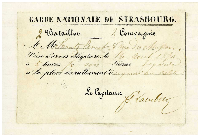
Convocation de la Garde Nationale de Strasbourg