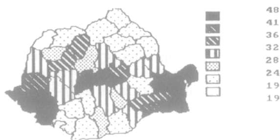
Fig. 2. Part de la S.A.U. en fermes d'Etat (1983), en pourcentages.

Les six premiers mois de l'année 1990, le plus fort déplacement a été enregistré vers les grandes villes qui ont reçu 304 000 nouveaux habitants (plus 14 % à Constanta).