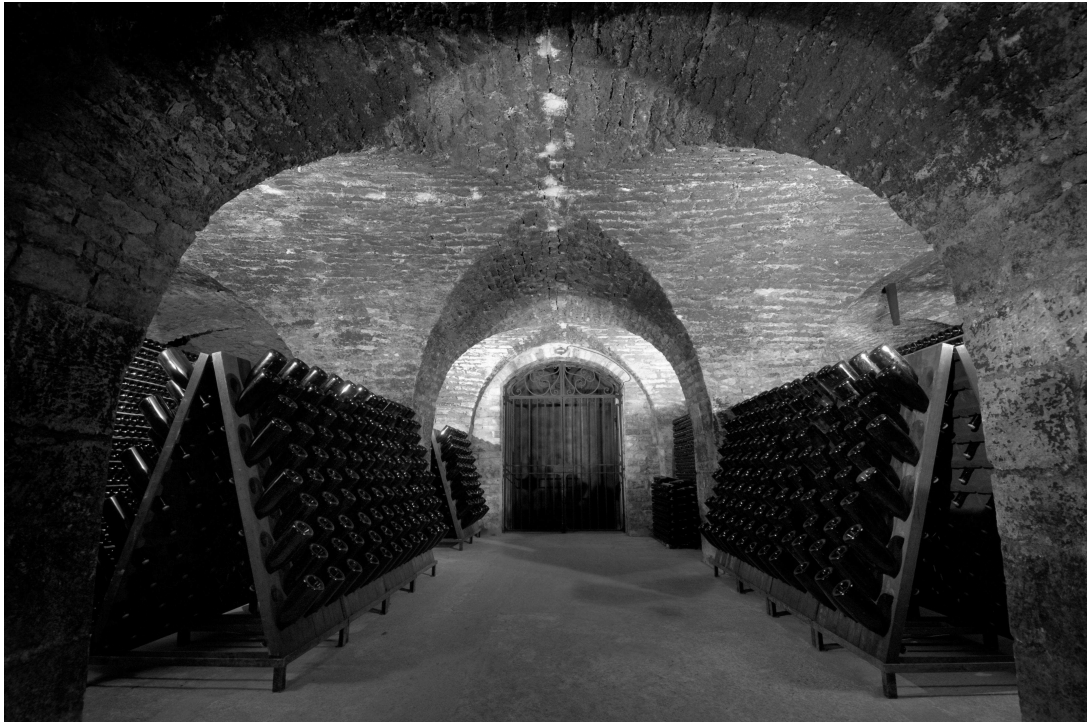
Zone d'engagement Aube Caves du Champagne Morize