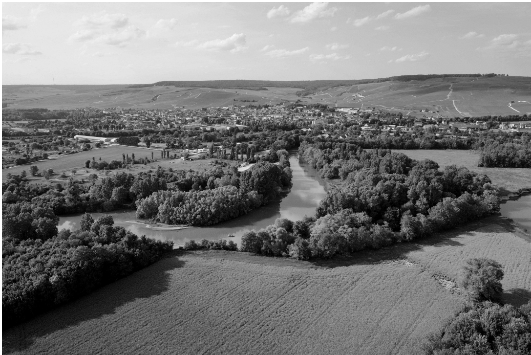
Éventail de vignes

Du point de vue des acteurs vitivinicoles extérieurs à la construction du dossier UNESCO, la labellisation suscite des appréhensions récurrentes. Durant les entretiens, trois points cristallisent les attentions. Une part importante des acteurs interrogés, en particulier les maisons de négoce, n'attendent pas ni ne souhaitent une augmentation du nombre de touristes dans leurs établissements : « nous ne souhaitons pas voir notre fréquentation touristique augmenter », « nous misons sur du tourisme qualitatif », « nous ne souhaitons pas modifier nos infrastructures pour accueillir plus de monde, ce n'est pas cela le Champagne » (paroles d'acteurs). De plus, la majorité des acteurs semblent réticents à engager des frais de valorisation patrimoniale, non pas pour des questions de budget mais davantage parce qu'ils : « n'en voient pas l'intérêt » cela est « très intellectualisé ». Certains diront même qu'il est « difficile de valoriser le paysage viticole » ; « l'attrait du paysage est très restreint en Champagne » (paroles d'acteurs), « il ne faut pas se leurrer sur la qualité visuelle des paysages champenois ». Pourtant, selon un rapport pour les ministères de l'Agriculture et Tourisme :