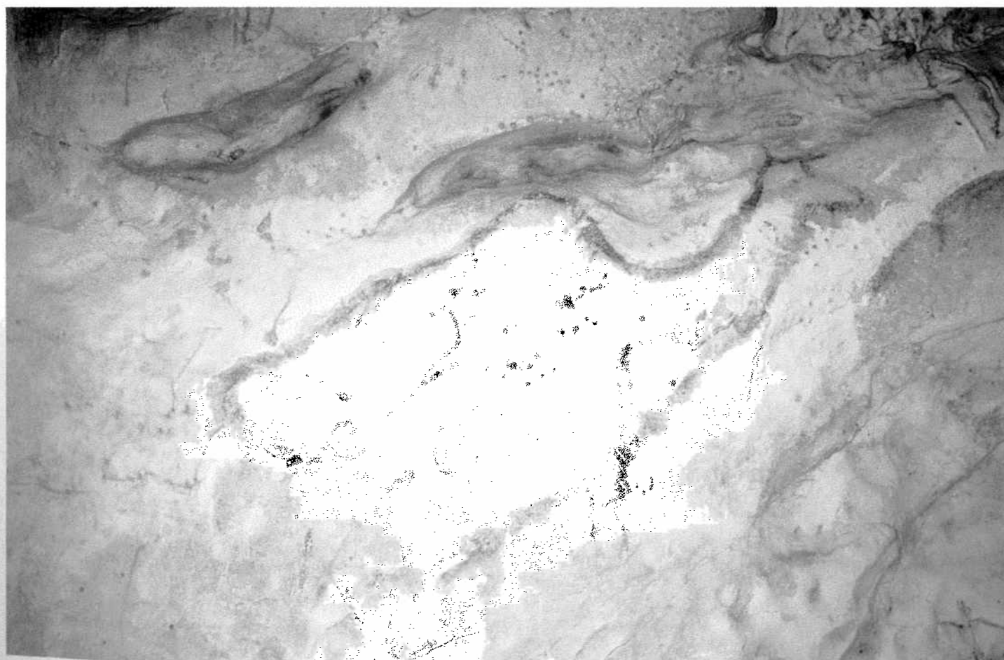
Fig. 1. Grand Mégacéros bichrome sur la corniche ouest de la salle des Vagues. (cliché M. Girard/CNRS ; coll. la Varende).