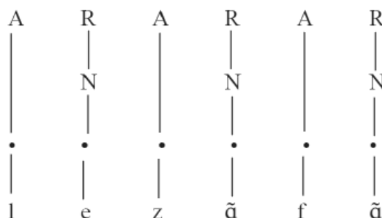
Figure 1. Schéma d'acquisition de la liaison : le premier stade (Wauquier & Braud, 2005)

C'est dans ce cadre que l'acquisition de la liaison a été formalisée par Wauquier (2009), Wauquier & Braud (2005). Grâce à ce concept de gabarit, l'acquisition de la liaison se déroule en quatre stades. Le premier stade concerne les enfants de 12 et 13 mois. Les associations dans les gabarits sont créées par les segments et les syllabes sont en relation de manière strictement alignée avec la position squelettale. Toutes les unités sont associées les unes aux autres dans un rapport de bi-univocité où ne sont présentes ni lignes autonomes, ni attaque branchante, ni coda (Figure 1).