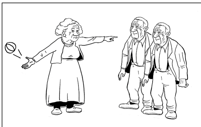
Figure 3 : Image correspondant à la phrase « la mamie qui montre les papis lance une balle ».

En outre, l'étude comporte différentes phases, qui permettent de faire varier les conditions de production (sous la dictée, à partir d'images, etc.). La quantité de données à traiter est donc considérable et l'analyse manuelle plus que laborieuse. De ce point de vue, les outils d'analyse des traces peuvent être d'une aide précieuse. En effet, certaines tâches parmi les plus fastidieuses peuvent être automatisées : la segmentation de la phrase, l'identification des régressions, etc. Même si une validation par les experts reste nécessaire, cela leur permet de se concentrer sur les tâches pour lesquelles leur expertise est la plus nécessaire. En outre, l'utilisation d'outils orientés experts pour l'analyse de traces (comme Tatiana [Dyke et al. 2008]) peut faciliter le croisement et la mise en correspondance des traces et données produites. Enfin, le stockage de