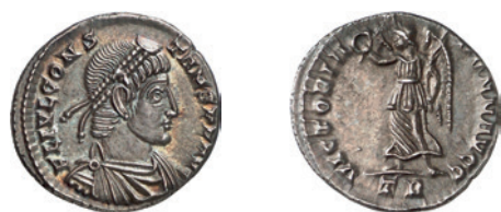
Fig. 2 « Siliqua » de Constant (347-348). Münzkabinett der Staatlichen Museen zu Berlin 18202825. – (Photo L.-J. Lübke). – Sans échelle.

Les études consacrées jusqu'ici à l'argent monnayé ont choisi une optique tardo-romaine ou alto-médiévale, sans tenter le pont entre les deux périodes. Comme l'avait déjà remarqué J.-P. Callu dans deux articles consacrés aux « Problèmes monétaires du quatrième siècle » 16 et aux « Frappes et trésors d'argent de 324 à 392 » 17 , on assiste à partir du milieu du IV e siècle à un renforcement significatif de la frappe de l'argent en Occident (fig. 2). De ce point de vue, son enquête ne laisse pas d'être éloquent dans la mesure où elle mit opportunément l'accent sur le rôle de l'argent dans les orientations monétaires du temps. Néanmoins, c'est l'or qui focalisa l'attention des chercheurs 18 .