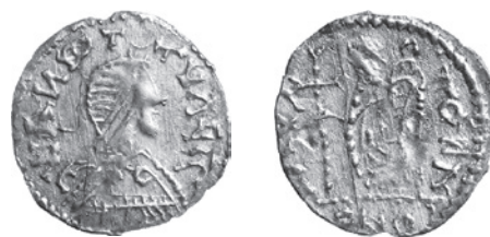
Fig. 3 Argenteus pseudo-impérial au nom de Valentinien III (après 425). RGZM O.2753. – (Photo R. Müller, RGZM). – Sans échelle.

Au terme de ce survol des travaux consacrés, de près comme de loin, à l'argent monnayé tardo-antique, le bilan apparaît bien maigre et dénote un relatif désintérêt de la recherche pour la monnaie d'argent, qui n'est