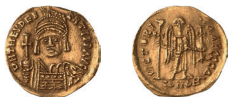
Fig. 1 Solidus de Théodebert (534-548). Münzkabinett der Staatlichen Museen zu Berlin 18202273. – Sans échelle.

métalliques, comme il est souvent avancé? Ou bien plutôt d'un tournant dans la politique monétaire des royaumes occidentaux après que Théodebert (534-548) (fig. 1), ayant osé émettre des solidi en son propre nom, eut ouvert la voie à un monnayage d'or royal en Occident?