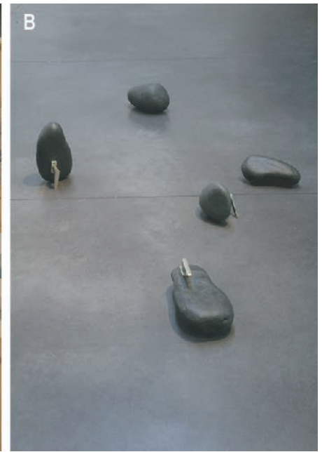
Fig. 1 – Géodiversités artialisées.