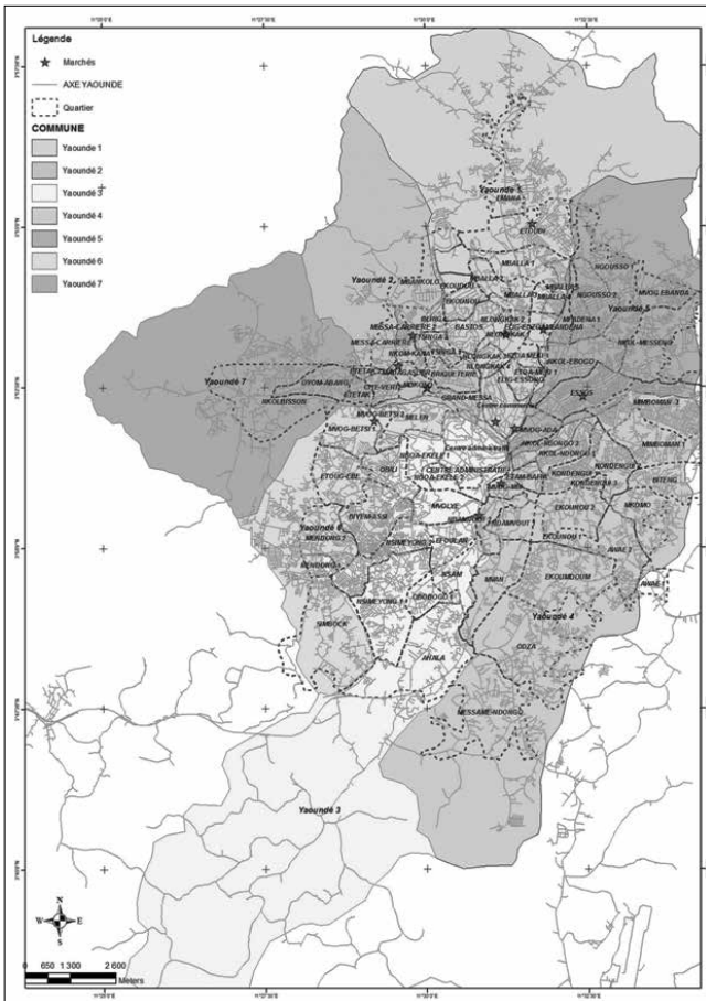
Carte 2. Les marchés de la ville de Yaoundé, bâtis par la CUY.

vers les quartiers pour favoriser le foisonnement des petits marchés nocturnes de rue. Certes, en journée, des activités existent dans les rues de la ville de Yaoundé (commerce ambulante, étals sur les trottoirs, vente de nourriture aux abords des rues, hangars de commerce...). Mais la nuit offre un nouveau visage à ces marchés : accroissement des commerçants et des clients ; diversification des marchandises vendues ; occupation d'un espace plus grand, entre autres. Tout ceci contribue à ce que De Villiers (1992) appelle « la petite économie marchande ».