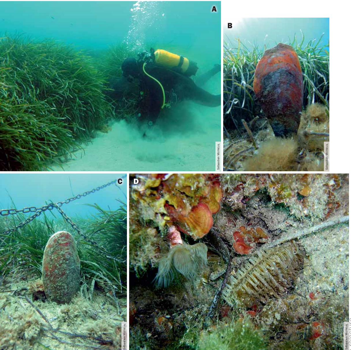
Figure 1. Pinna nobilis et son habitat naturel. A, l'herbier de posidonies ; le plongeur illustre l'épaisseur et la densité que peut atteindre cet herbier au printemps. B, Pinna nobilis en position de vie. C, Pinna nobilis adulte à proximité de chaînes de mouillage. D, Pinna nobilis juvénile.

Pinna nobilis Linnaeus, 1758, encore appelée « Grande nacre », peut légitimement s'enorgueillir du titre de « plus grand bivalve de Méditerranée » : sa longueur atteint en effet les 90 cm, voire un mètre pour les spécimens les plus âgés (VICENTE, 2003). La forme triangulaire caractéristique de sa coquille ainsi que sa couleur brun-rouge sont à l'origine de son surnom de « jambon ou jambonneau de mer ». Parmi les autres noms vernaculaires, citons celui de « jambonneau hérissé », de « pinne noble » ou de « pinne géante ». Les anglo-saxons, quant à eux, la surnomment « fan mussel », « noble pen shell », « razor fish » ou « rough pen shell ».