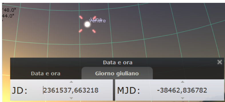
Fig.3: L'immagine è la simulazione da Leida al 27 Luglio 1753.

Johann LULOFS. Waarneeming der bedecking van Venus door de maan, d. 27. July 1753 gedaan te Leyden. Verhandel. van het Maatsch. te Haarlem. Deel. 1. Bl. 382 (Figura 3).