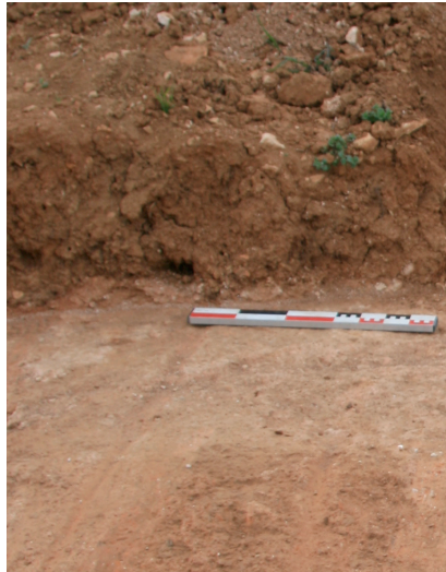
Figure 2. Béton de sol gallo-romain, préservé lors de la replantation d'une parcelle viticole aux « Iles des Vergelesses » à Pernand-Vergelesse.