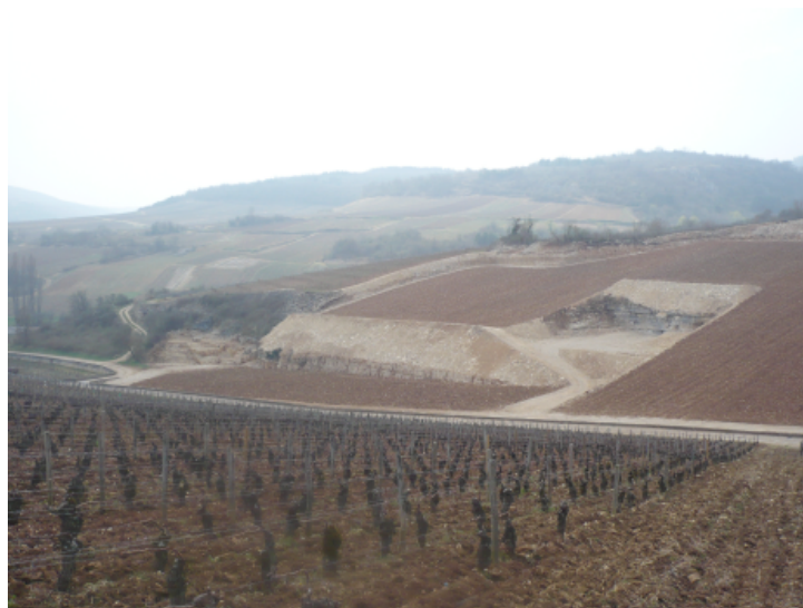
Figure 4. Remodelage drastique d'un versant à Saint-Romain (Photo C. Petit).