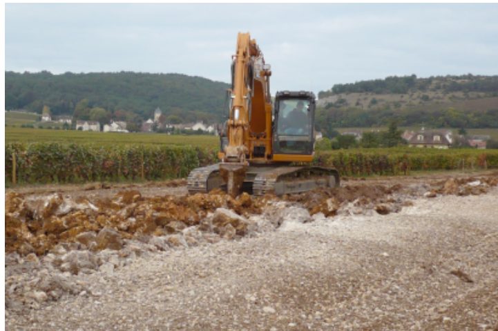
Figure 3. Sousolage et broyage du substrat géologique observé en Côte-de-Nuits. La texture et les caractéristiques chimiques du sol sont fortement transformées.