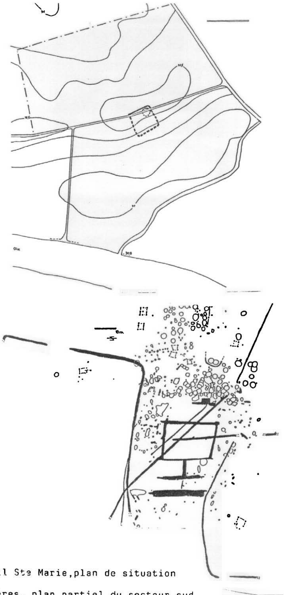
En haut, Longueil Ste Marie, plan de situation