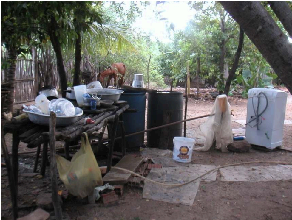
Figure 6. Photo de l'aménagement d'une arrière-cour.

La photo illustre une structure en bois installée pour nettoyer la vaisselle, et une machine à laver raccordée au réseau d'eau domestique. Le tuyau (au premier plan) sert à remplir les bidons en plastique en saison sèche et à rincer la vaisselle.