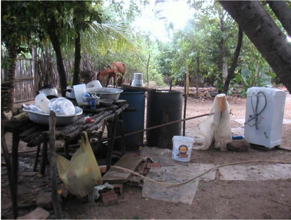
Figure 6. Photo de l'aménagement d'une arrière-cour.

La photo illustre une structure en bois installée pour nettoyer la vaisselle, et une machine à laver raccordée au réseau d'eau domestique. Le tuyau (au premier plan) sert à remplir les bidons en plastique en saison sèche et à rincer la vaisselle.