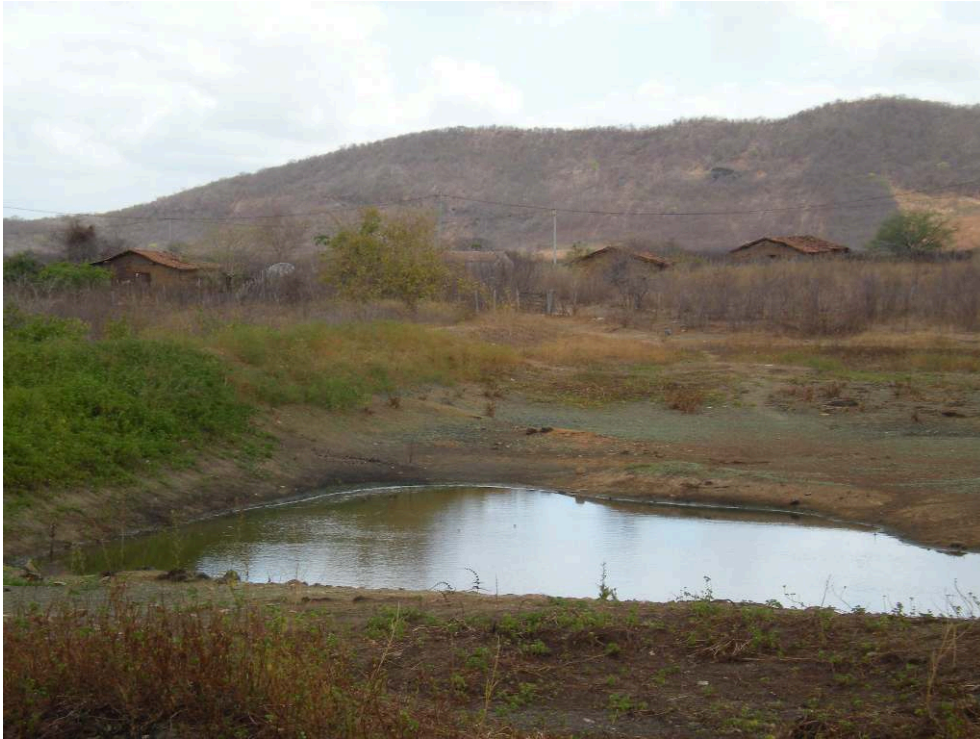
Collard. Lagoa, décembre 2010.