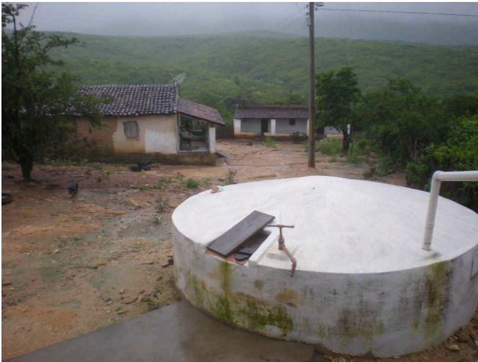
Figure 4. Photo d'une citerne d'eau de pluie financée par l'Asa-Brasil.

La pompe manuelle permet d'extraire l'eau de la citerne. En cas de panne, l'eau est directement puisée avec un seau via la trappe.