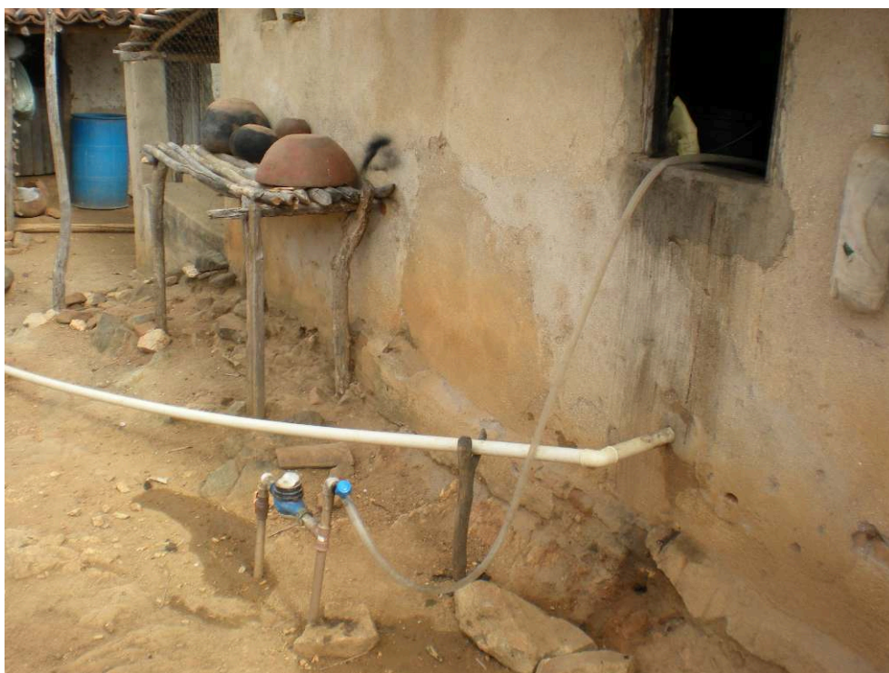
Figure 2. L'alimentation en eau vu de l'extérieur.

Le compteur d'eau individuel est placé dans l'arrière-cour de la maison. Un tuyau de raccordement est passé par la fenêtre de la cuisine pour adapter le dispositif aux usages domestiques. Une canalisation (blanche) permet de récupérer les eaux de vaisselle pour arroser plus loin quelques plantations.