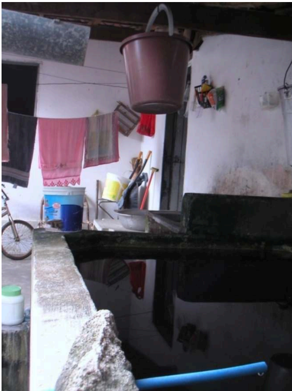
Figure 5. Bassin construit au sein de l'espace domestique.

Le bassin est rempli avec l'eau du robinet grâce au tuyau bleu fixé par une pierre, et avec l'eau de pluie acheminée par une gouttière métallique. L'eau est ensuite puisée avec le seau en plastique accroché au-dessus du bassin.