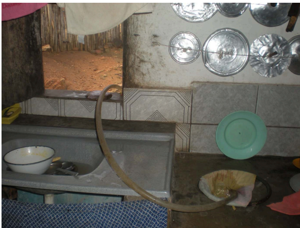
Figure 3. L'alimentation en eau vu de l'intérieur.

À défaut d'installer un système de canalisation à l'intérieur de la maison, le tuyau permet de remplir le réservoir de la cuisine. L'eau sera ensuite prélevée manuellement pour faire la vaisselle, remplir les casseroles d'eau de cuisson ou encore nettoyer les aliments.