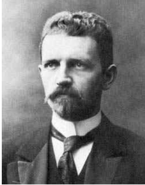
FIGURE 4 – Niels Nörlund

Déjà en 1927, Adolphe Bühl avait analysé un autre mémoire de Niels Nörlund, « Leçons sur les séries d'interpolation », rédigées par René Lagrange. Au sujet de René Lagrange, Adolphe Bühl indique :