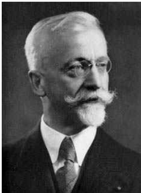
FIGURE 2 – Elie Cartan

10 tonnes, et l'on néglige, par rapport à lui, le poids des organes de suspension. Ce cylindre est utilisé comme cible pour des balles de mitrailleuses dont la vitesse est parallèle à son axe et qui s'incorporent dans sa masse symétriquement à l'axe. Le poids de chaque balle est de 10 g et l'on en tire dix par seconde. La durée du tir est assez courte pour que le poids total des balles tirées soit négligeable par rapport au poids du cylindre, et assez longue cependant pour que le cylindre prenne une position apparente d'équilibre, dans laquelle la droite AB, cessant d'être verticale, fait un angle de 3 décigrades avec la verticale. Calculer la vitesse des balles.