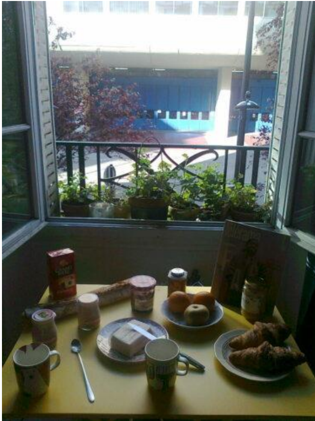
Déjeuner sur fenêtre !

pour manger, et ensuite me remettre devant l'écran de travail. Avant de finir la journée, souhaiter une bonne soirée aux groupes des confinés de Belleville et ensuite pratiquer la marche sportive d'une heure pour se dégourdir les jambes et admirer l'évolution des jardins. ( Pascal, Lab&doc IPRAUS/AUSser )