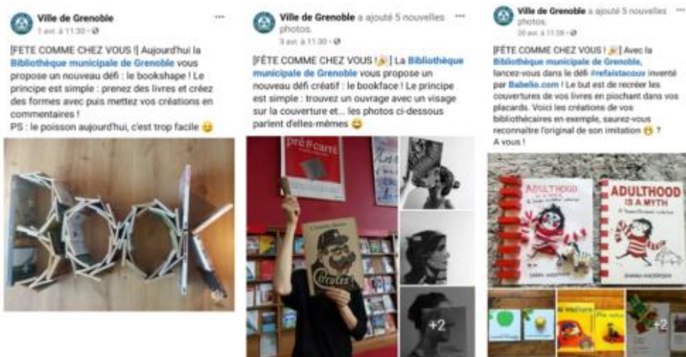
Publications Facebook de la Ville de Grenoble