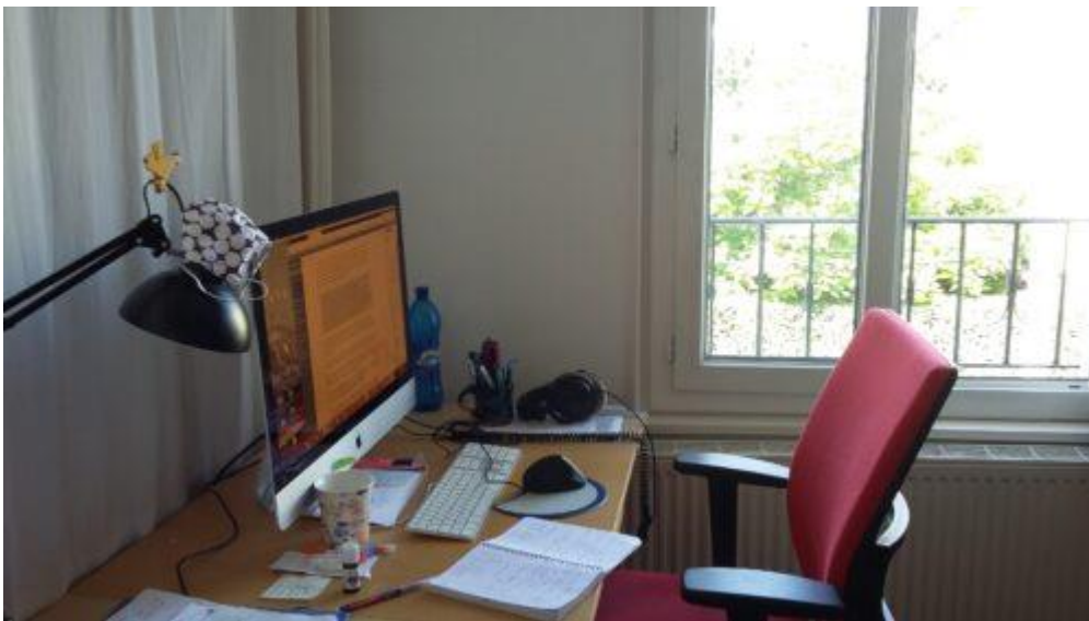
• Bureau-chambre !