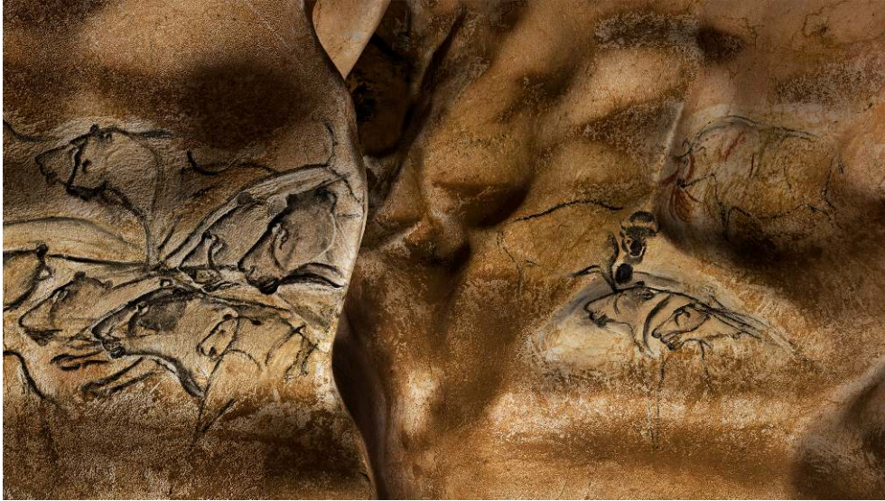
Parois ornées de la Salle du Fond de la grotte Chauvet-Pont d'Arc. Photogramme extrait du film Le Dernier Passage de Pascal Magontier et Jean-Michel Geneste, réalisé à partir du modèle 3D de la grotte.

Dans le même ordre d'idée, le film animé Pearl de Patrick Osborne, tourné à 360° en 2017, met en scène une histoire se déroulant dans une voiture 11 . Selon la direction du regard du spectateur, la narration prend des chemins différents, induite par des temporalités localisées dans une direction ou dans une autre. En outre, le temps n'est pas nécessairement défilant : il peut être condensé sur l'espace de la toile comme le Nu descendant un escalier que Marcel Duchamp a présenté en 1912 ou, dans le cas des panoramas et des films à 360°, concentré à la surface d'une sphère ou d'un cylindre.