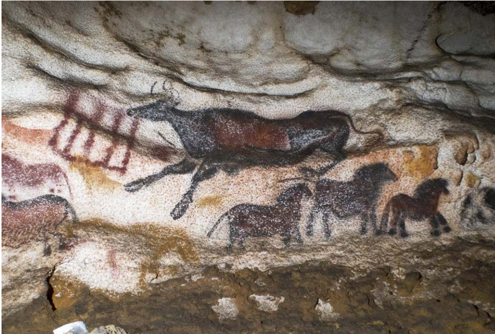
Perois ornées de la grotte de Lascaux.

d'expérimenter l'espace réel de la grotte à l'échelle 1, mais replié, densifié, rempli d'ellipses narratives qui imposent un rythme à la visite. Les archéologues et géomorphologues de l'équipe de recherche ont eux-mêmes sélectionné et conçu les séquences narratives retenues, et déterminé ces ellipses afin que le rythme final soit similaire à celui de la grotte initiale 23 . Comme l'aurait fait un scénariste pour une visite immersive en images, les architectes ont transformé le temps en espace pour augmenter, par compression émotionnelle, la sidération des visiteurs.