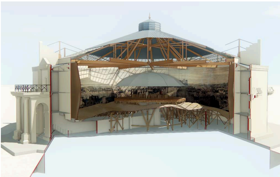
Modélisation 3D d'un panorama-type du XIX e siècle à partir des plans dressés par Jacques Ignace Hittorff (1792-1867) dans son ouvrage Description de la Rotonde des panoramas élevée dans les Champs-Élysées (1842).