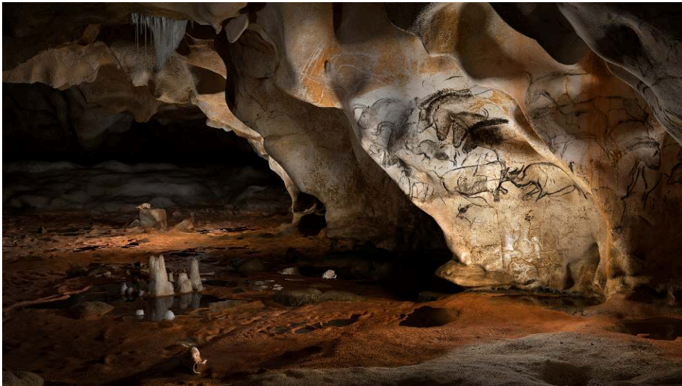
La Salle du Crâne de la grotte Chauvet-Pont d'Arc. Photogramme extrait du film Le Dernier Passage de Pascal Magontier et Jean-Michel Geneste, réalisé à partir du modèle 3D de la grotte.

Modélisation 3D : Perazio Engineering / éclairage : Hugo Barbier / cliché : Rup'art productions.