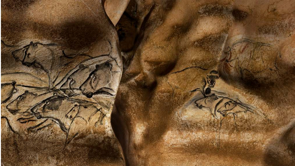
Parois ornées de la Salle du Fond de la grotte Chauvet-Pont d'Arc. Photogramme extrait du film Le Dernier Passage de Pascal Magontier et Jean-Michel Geneste, réalisé à partir du modèle 3D de la grotte.

Dans le même ordre d'idée, le film animé Pearl de Patrick Osborne, tourné à 360° en 2017, met en scène une histoire se déroulant dans une voiture 11 . Selon la direction du regard du spectateur, la narration prend des chemins différents, induite par des temporalités localisées dans une direction ou dans une autre. En outre, le temps n'est pas nécessairement défilant : il peut être condensé sur l'espace de la toile comme le Nu descendant un escalier que Marcel Duchamp a présenté en 1912 ou, dans le cas des panoramas et des films à 360°, concentré à la surface d'une sphère ou d'un cylindre.