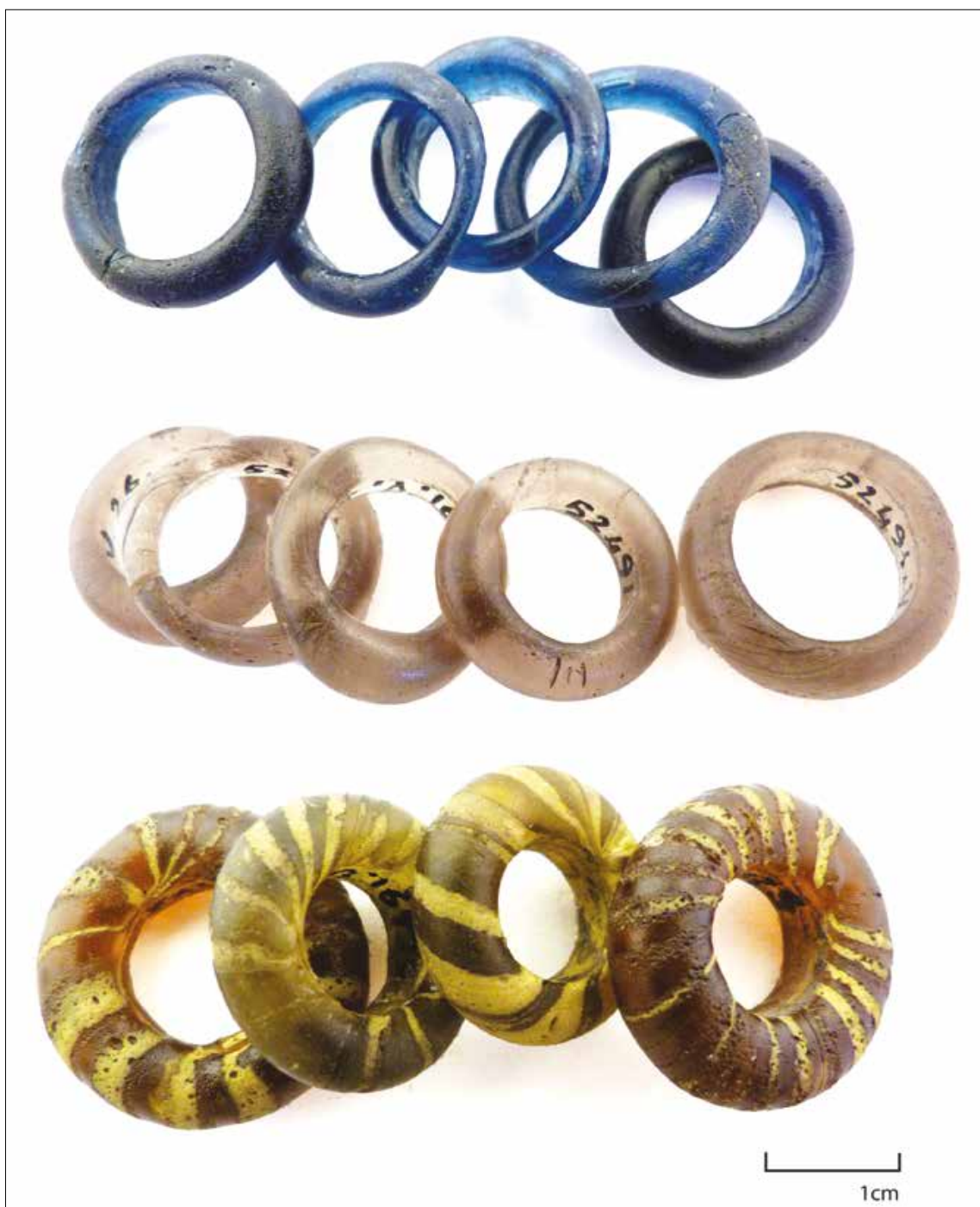
Fig. 2. Lots de perles issues du dépôt de verrerie de Mandeure présentant des caractéristiques pouvant indiquer une fabrication dans un même moment. Musée d'archéologie Nationale - Domaine national de Saint-Germain-en-Laye (cl. J. Rolland).

Lors de la fabrication du verre, les sables utilisés apportent avec eux des impuretés. Parmi elles, les oxydes de fer ( \text{Fe}^{2+} ),