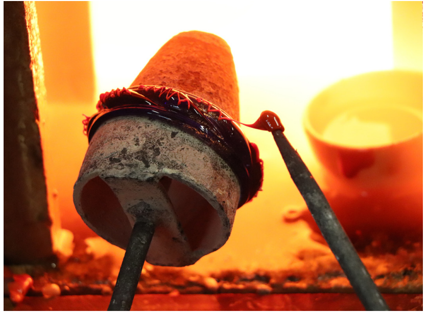
Fig. 3. Expérimentation des techniques de décoration des bracelets par Joël Clesse. Ici positionné sur un cône en métal, les bracelets peuvent être décorés de filets en 8 ou en zig-zag. Pour obtenir des filets plus fins et plus minutieux des temps d'apprentissage long et de répétitions des gestes sont nécessaires

La reconstruction des systèmes techniques dans lesquels s'insèrent les parures en verre celtiques permet de développer une autre lecture des significations des messages véhiculés par le port de ces objets dans les sociétés celtiques. Pour les populations laténiennes, le verre est un matériau encore rare, exotique et dont la transformation nécessite des artisans spécialisés. Il se distingue par le son qu'il produit, par sa couleur et sa transparence, sans équivalent dans la parure à cette période. Les parures en verre ont donc probablement une valeur marchande