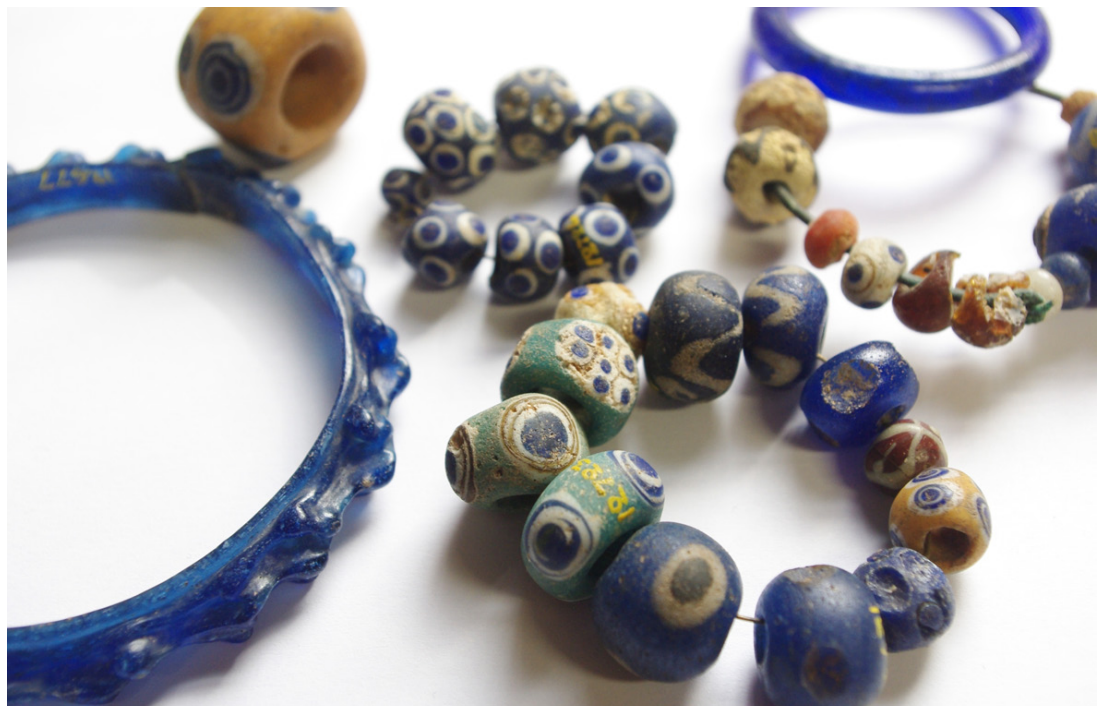
Fig. 1 Bracelets et perles de verre trouvés à Saint-Étienne-au-Temple (Marne, France) - Musée d'archéologie Nationale - Domaine national de Saint-Germain-en-Laye.

Note 1 UMR 8215 Trajectoires, UMR 5060 Iramat / Ceb joelle.rolland3@gmail.com