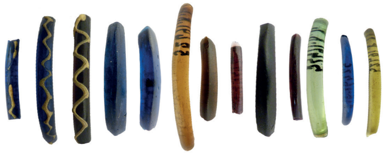
Fig. 4 Fragments de bracelets en verre produits à la fin du II e siècle av. J.-C. et au I er siècle av. J.-C. trouvés dans un dépôt du sanctuaire de Mathay-Mandeure (Doubs), Musée d'archéologie Nationale - Domaine national de Saint-Germain-en-Laye, numéro d'inventaire des objets du dépôt MAN 52491.

et une valeur «travail» élevée, mais aussi une valeur symbolique. En consommant ces parures de prix, les populations qui les portent montrent leurs capacités à acquérir ces biens et à dépenser de la richesse pour les acquérir. La production de parure en verre est donc d'abord une production de marqueur de richesses. Elle nourrit le système de consommation ostentatoire des sociétés laténiennes qui s'exprime également à travers les vestiges matériels de la consommation de biens de bouches luxueux, comme le vin.