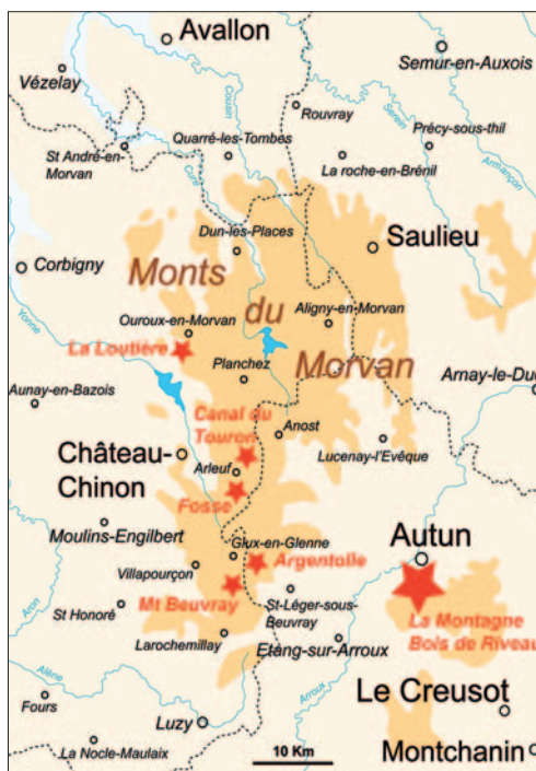
Carte des minières du Morvan. DAO B. Cauuet/CNRS.

déterminante pour les identifier comme des minières, anciens ouvrages miniers travaillés pour partie à ciel ouvert. Ces minières peuvent mesurer de quelques dizaines à plusieurs centaines de mètres de longueur, jusqu'à 15 m de profondeur et 25 à 30 m de largeur. Ce type de site minier est désormais bien connu en Limousin, mais également dans l'ouest de l'Auvergne, dans le sud de la Mayenne, comme en Ariège, près d'Ax-les-Thermes (Cauuet, 2005).