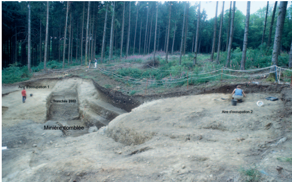
Minière en cours de fouille sur le Mont Beuvray.

l'excavation en fosse-dépotoir par les habitants de Bibracte après son abandon confirme que l'ouvrage est antérieur à la création de la ville.