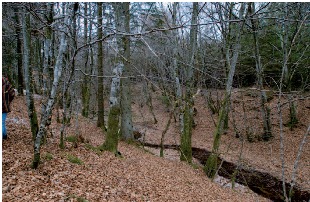
Fosse du Canal du Touron (Arleuf).

Un chantier-ravin pour étain à Autun.