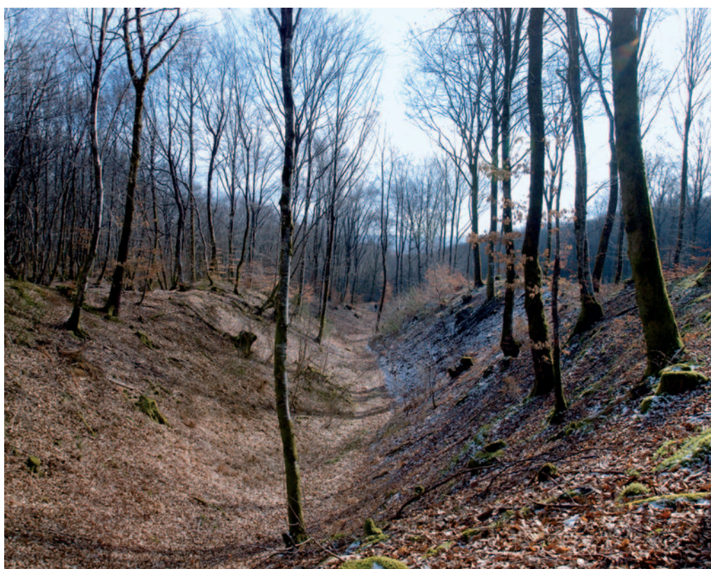
Minières de La Loutière (Ouroux-en-Morvan).

Ces dernières années, et depuis la découverte de nombreux ateliers de forgerons et de bronziers sur l' oppidum de Bibracte et dans la ville romaine d'Autun, Augustodunum , s'est posée la question de l'origine des métaux travaillés dans la cité des Éduens. La présence de nombreux petits gîtes ferrifères exploités dans l'Antiquité dans le nord de cette cité est une certitude depuis les recherches menées par l'équipe de Michel Mangin (Mangin et al. , 1992). En revanche, la provenance des métaux non ferreux utilisés, notamment ceux entrant dans les alliages à base cuivreuse (cuivre, étain, plomb, zinc), restait méconnue.