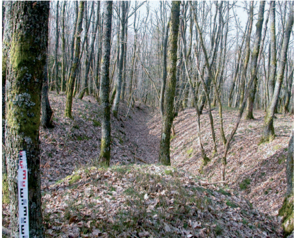
Un canal d'adduction d'eau aux stannières d'Autun.

jamais aisée en l'absence de fouilles qui sont nécessaires pour accéder aux fronts de taille anciens aujourd'hui masqués par les remblais de comblement.