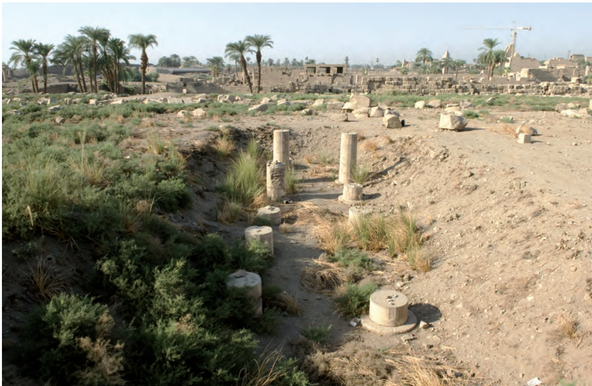
fig. 1 La colonnade de la salle à banquettes du Trésor de Shabaqo en 2008, avant le début des fouilles (vers le sud) ; en arrière-plan, l'Akhmenou.

S ous le règne du roi Shabaqo, le secteur au nord du temple d'Amon-Rê à Karnak fit l'objet d'un réaménagement important : la construction d'un nouveau Trésor en fut l'un des éléments majeurs.