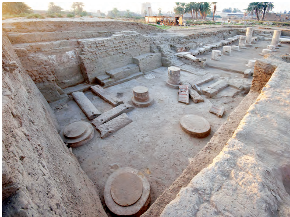
fig. 6 (ci-dessus)

Les investigations archéologiques menées jusqu'à présent sur le site du Trésor de Shabako ont montré qu'un projet de construction d'envergure fut mis en place sous le règne de ce roi afin de rénover le siège d'une des principales institutions économiques de l'État égyptien.