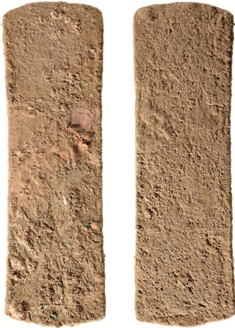
Plaque en alliage cuivreux, avant restauration. Éch. 1/1,5.

N. LICITRA, Une plaque aux noms du premier prophète Menkhéperrê et du prêtre Horemakhbit