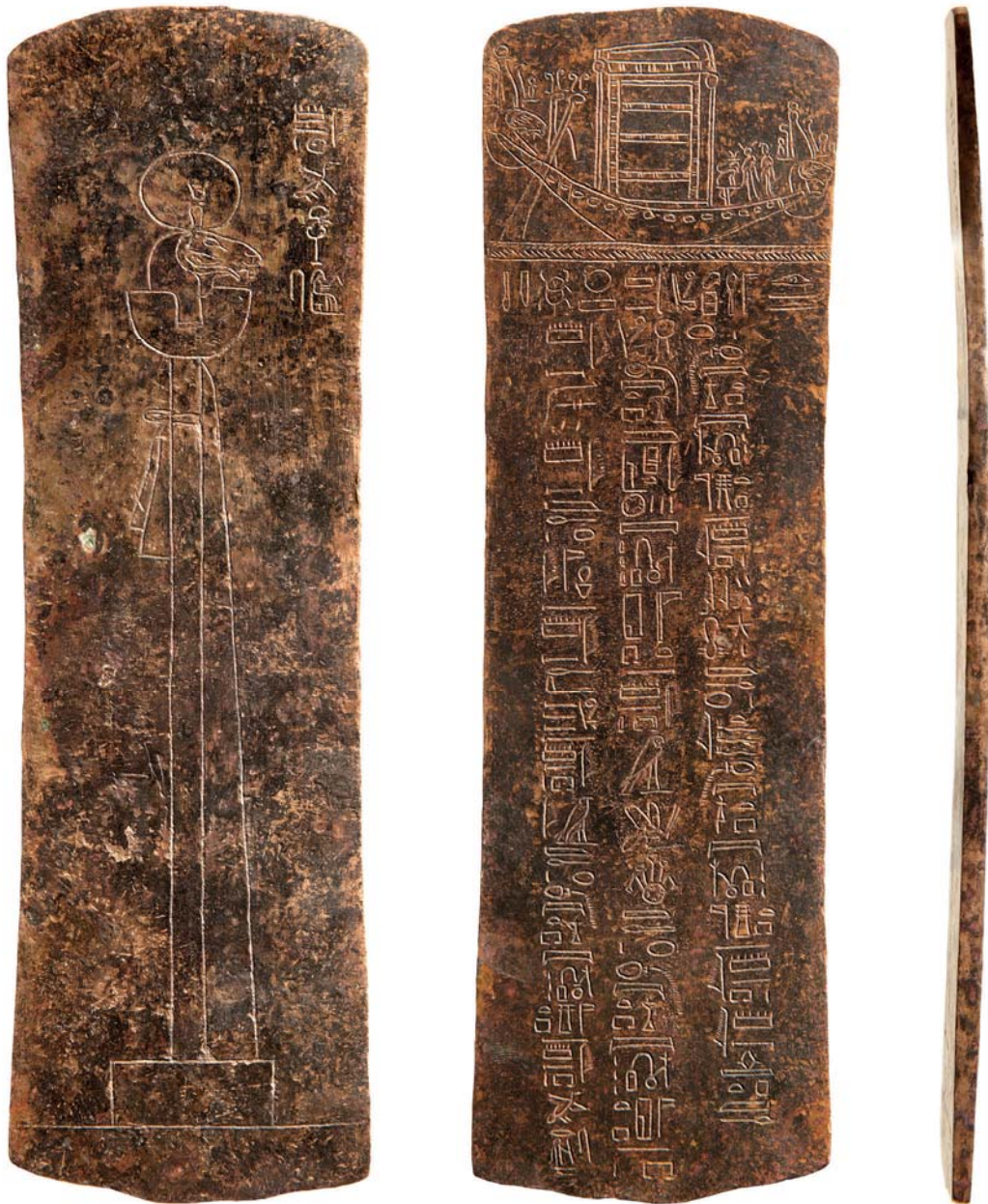
Plaque en alliage cuivreux, après restauration. Éch. 1/1,5.

N. LICITRA, Une plaque aux noms du premier prophète Menkhéperê et du prêtre Horemakhbit