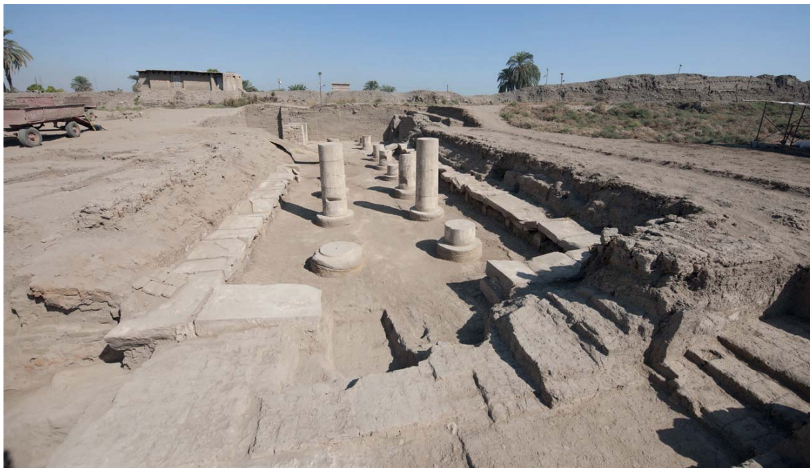
Fig. 8 La salle à banquettes du Trésor vue du sud

Depuis le sanctuaire, on accède, au nord et au sud, à deux pièces annexes. La salle nord n'a pas encore été mise au jour alors que la pièce au sud, entièrement fouillée, correspond à la salle hypostyle dégagée anciennement. Cette pièce se démarque par la présence de banquettes en grès installées le long des murs qui ont été en partie récupérées après la désaffectation du Trésor (fig. 8).