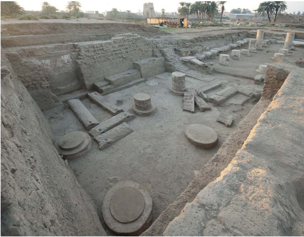
Fig. 6 Le sanctuaire du Trésor lors de sa découverte en 2010. Vue du nord-ouest