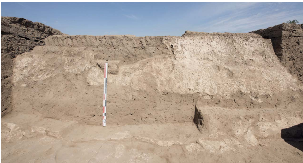
Fig. 10 La paroi ouest du premier magasin sud

archéologique principale pour connaître la nature et l'origine des produits entreposés dans les magasins demeure le matériel céramique. Dans le cas du Trésor de Chabaka, ce sont en particulier les récipients découverts sur les sols des pièces et associés à la dernière période d'occupation de l'édifice qui ont transmis les renseignements les plus utiles. Pour l'heure, outre des jarres égyptiennes en pâte limoneuse dont l'association avec un produit spécifique n'est pas aisée à déterminer, il est possible de mentionner des sigas des oasis, habituellement employées pour le transport de produits agricoles oasiens tels le vin ou l'huile d'olive, ainsi que des amphores samiennes dont la fonction de récipients oléicoles est avérée depuis longtemps. Cinq types différents d'amphores levantines attestent également l'importation de vin et d'huile de Phénicie 25 .