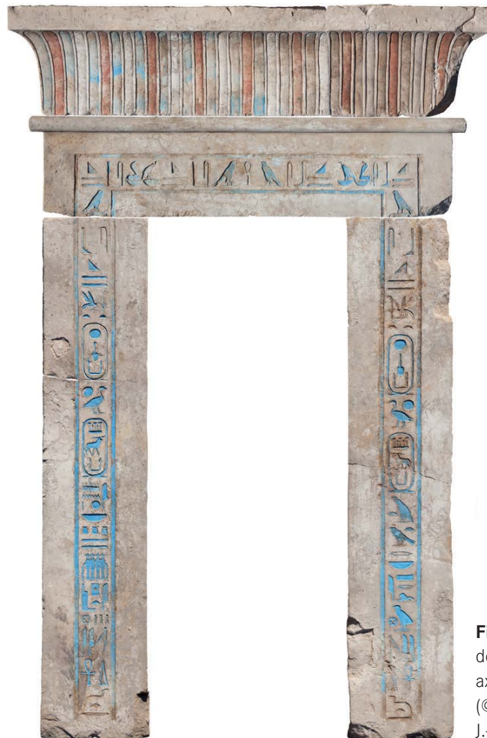
Fig. 7 L'encadrement de porte de la niche axiale du Trésor