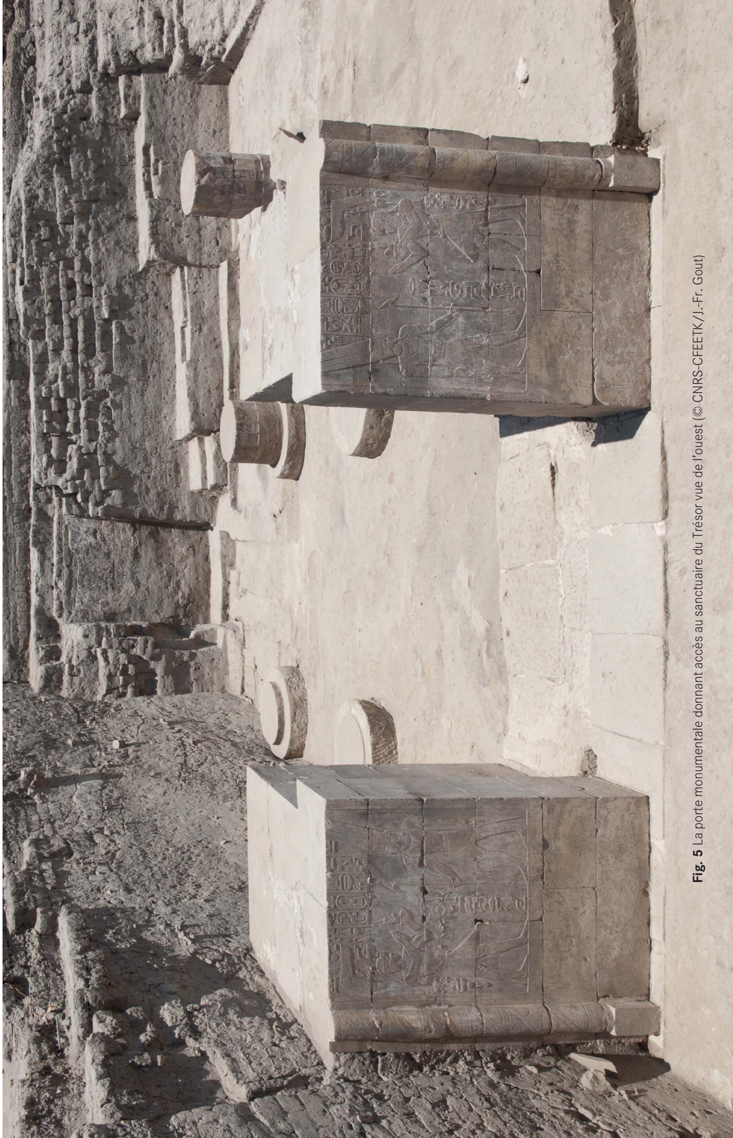
Fig. 5 La porte monumentale donnant accès au sanctuaire du Trésor vue de l'ouest