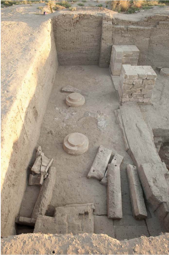
Fig. 9 L'angle sud-est de la cour à portique du Trésor et les encadrements de porte des magasins I et II sud. Vue du sud

Les listes des produits entreposés dans les Trésors transmises par les sources écrites 23 mentionnent, de manière générale, des denrées précieuses, rares dans certains cas, des matériaux bruts, des objets manufacturés ainsi que des produits alimentaires qui ne nécessitaient pas une transformation immédiate tels l'argent, l'or, le cuivre, les pierres précieuses, le linge, l'encens, le vin, l'huile, le miel.