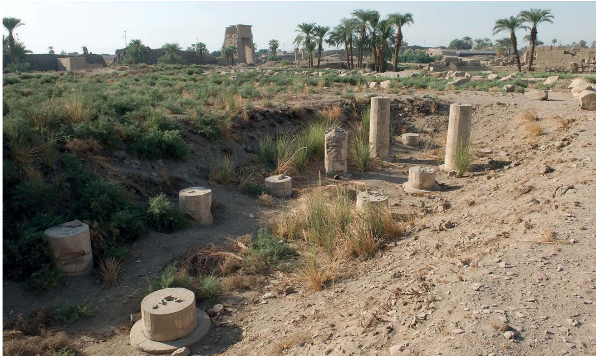
Fig. 2 Le site du Trésor de Chabaka avant le début des fouilles en 2008, vu du nord-ouest

Du fait de leurs caractéristiques architecturales et de leur localisation dans les temenoi , quatre autres complexes de stockage sont probablement à identifier avec des Trésors :