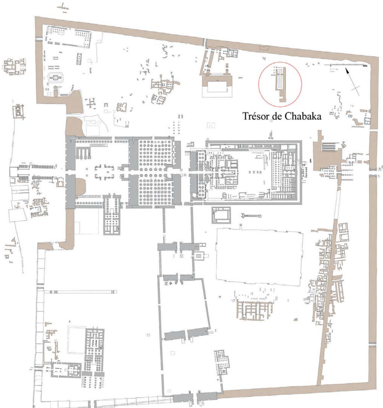
Fig. 1 Plan général du domaine d'Amon-Rê à Karnak

de 1817 à 1823 3 . Cette hypothèse est plausible, voire fort probable, mais l'absence dans les archives de tout document en relation avec ce dégagement ne permet pas, pour l'heure, de le prouver de manière certaine.