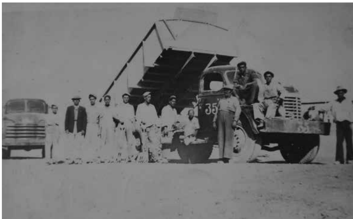
Figura 2. Arrenquines en Flor de Chile, año 1966.

bajo control de capitales extranjeros, principalmente ingleses y alemanes, muchos de los cuales habían iniciado su ascenso económico gracias al financiamiento generoso de capitales bancarios nacionales (Bermúdez 1987).