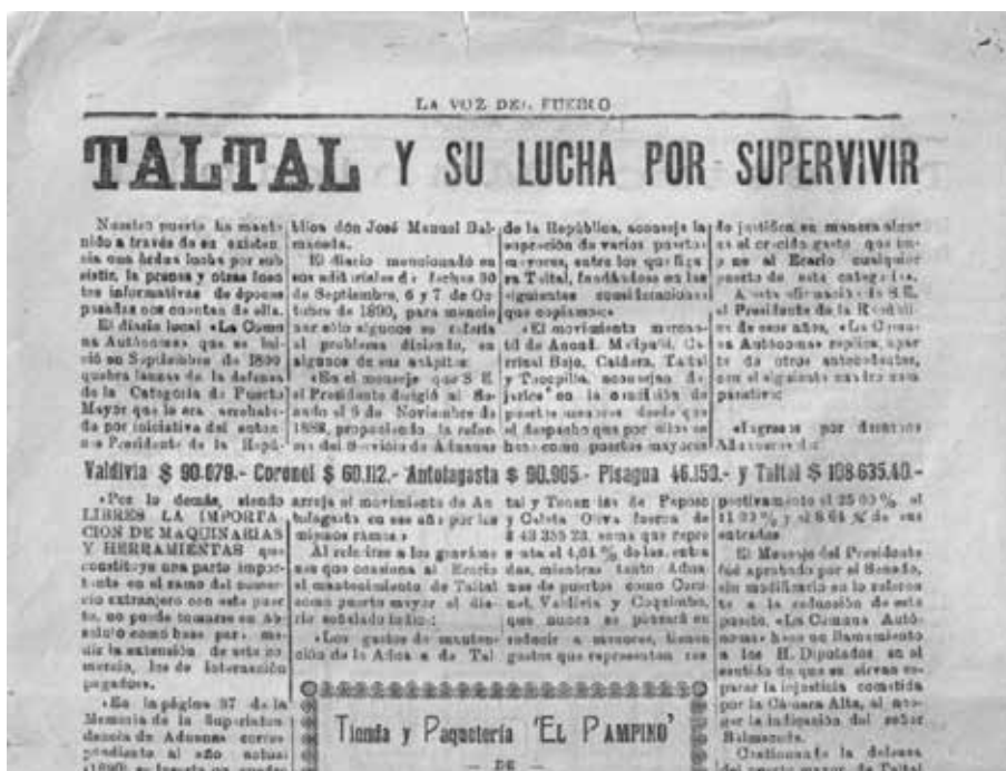
Figura 3. Diario La Voz del Pueblo , Taltal. 12 de julio de 1958.

unos 9.000 trabajadores y su exportación no sobrepasaba el millón de toneladas, muy por debajo de los tres millones que exportó en sus mejores años. La producción nacional era sostenida básicamente por las oficinas con tecnología Guggenheim: María Elena y Pedro de Valdivia. Mientras tanto en Taltal sólo sobrevivirá la Oficina Alemania, aunque no por muchos años (Figura 3).