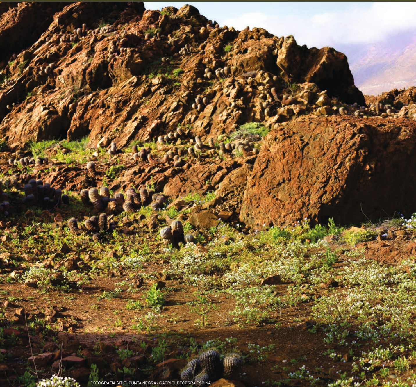
FOTOGRAFÍA SITIO PUNTA NEGRA / GABRIEL BECERRA ESPINA

Revista Taltalia del Museo Augusto Capdeville Rojas de Taltal N° 3 Año 2010