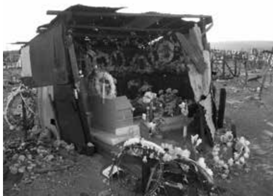
Figura 5. Cementerio de Refresco recientemente revisitado.

denominado el imaginario del salitre, un espacio de voces polisémicas que da forma a múltiples narrativas históricas.