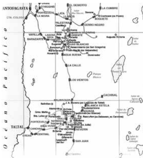
Figura 1. Mapa del cantón de Taltal.

Que las condiciones del presente determinan los problemas y las interpretaciones del pasado es un hecho bien reconocido en la actualidad, siendo la dimensión socioeconómica una de las más influyentes en el contexto de una sociedad capitalista; tal como reconoce recientemente Walker, “class and class relations permeate all aspects of capitalist society, and as a part of society archaeology embodies these relations” (Walker 2008:98). Por tanto, destacamos el rol de los arqueólogos en la construcción de relatos sociales o narrativas históricas, entendiendo que en esta práctica se concretan los vínculos con la realidad social (Sepúlveda 2008).