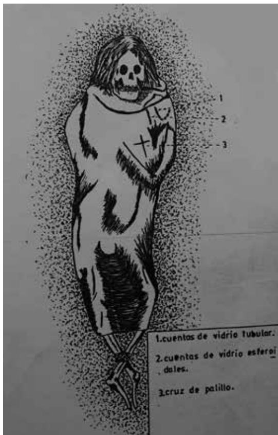
Figura 2. Croquis de uno de los cuerpos recuperados durante el rescate arqueológico en Caleta Abtao temporalmente adscrito al contacto hispano-indígena (Bravo 1981).

nos da señales acerca del valor de uso de estos bienes, vinculado a su uso como adorno y al ámbito funerario.