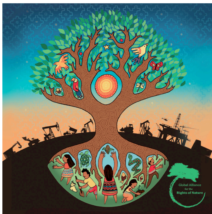
Figure 2. Pour de nouvelles relations entre humains et non humains

Essayer de comprendre ce qui peut rendre notre monde aussi habitable que possible, c'est donc forcément envisager ce que signifie un milieu pour ses habitants. En ce sens, toute géographie du bien-être ne peut se réduire à une évaluation des besoins socio-économiques des individus mais doit envisager les systèmes de relations structurés au sein des milieux (Bailly, 2014 [1981]). Car ce sont ces relations spécifiques à un certain espace qui sont susceptibles d'être mobilisées pour faire émerger un agir éthique « situé » qui n'a plus rien d'imposé mais jaillit naturellement pour répondre à un besoin spécifique (Tollis, 2010). L'attention au milieu est donc d'abord une attention pour un espace vécu, pratiqué et perçu, un espace de la vie au sein duquel les significations naissent et deviennent cohérente sur la base de l'intrication entre des expériences sensibles et conscientes. Ce souci pour le milieu habité est aussi un acte politique, une manière de résister à une déterritorialisation constitutive d'un « uni-monde » néolibéral et à ses logiques technico-économiques qui ne cessent de vouloir imposer un ordre rationnel et utile. Prendre soin du milieu, c'est au contraire rendre possible le déploiement de mondes multiples, l'existence d'un plurivers riche de relations signifiantes entre ses co-habitants (Escobar, 2018).