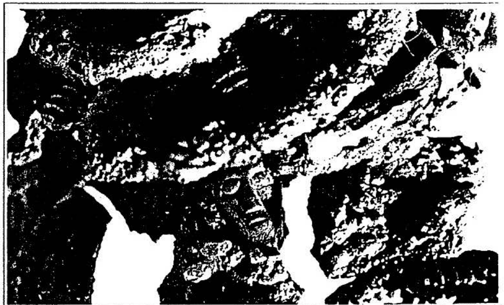
Casque de Montlaurès. Détail de l'une des têtes en corail (avant restauration); ht. 12,5 mm.