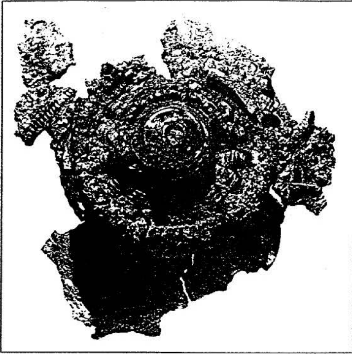
Casque de Montlaurès. Vue générale de la partie sommlitale (avant restauration).