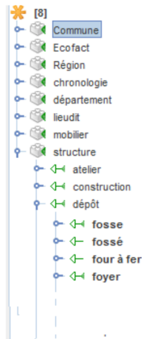
FIGURE 5 – Tydi : un éditeur d'ontologie

Afin de structurer le vocabulaire, l'ensemble des termes extraits, nous avons utilisé un éditeur initialement développé par l'INRA. Tydi (Terminology Design Interface) est un outil collaboratif pour la validation et la structuration de termes en ontologie. Il est intégré à AlvisAE (Alvis Annotation Editor [?]), plateforme d'annotation en ligne. Cette plateforme permet de visualiser et d'annoter les entités, de lier et typer les entités. Il permet la gestion de campagnes d'annotation. C'est un éditeur complexe, spécifique au traitement de données biologiques.