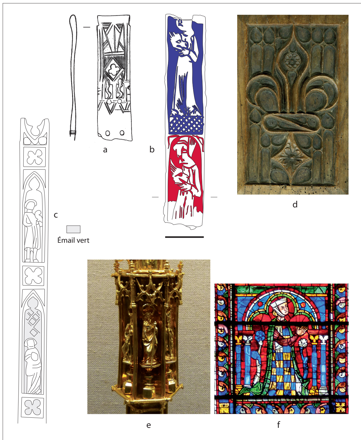
Fig. 2 – a - Chape en alliage cuivreux, vers 1309/1315 - vers 1345, Castrum Saint-Jean , Rougiers, Var, © J. Lenne/LA3M. b - Fragment de chape ou de mordant en alliage cuivreux émaillé de bleu et de rouge, datation inconnue, rue Carreterie, Avignon, Vaucluse, © O.Thuadet. c - Dessin sommaire d'une partie du mordant en argent doré et émaillé d'une ceinture du trésor d'Erfurt en Allemagne, enterré en 1349, actuellement conservé dans la synagogue d'Erfurt, © O.Thuadet. d - Panneau de bois sculpté avec fleur de lys en remplage, début/milieu du XVI e siècle, collection A. Hartmann-Virnich, © A. Hartmann-Virnich. e - Détail d'une crosse de bâton épiscopal, argent et vermeil, fin du XV e siècle, Trèves, cathédrale, trésor © A. Hartmann-Virnich. f - Anonyme, Alix, Vitrail du transept sud de la cathédrale de Chartres, vers 1230, © Ludwig Schneider, CC BY-SA 3.0.