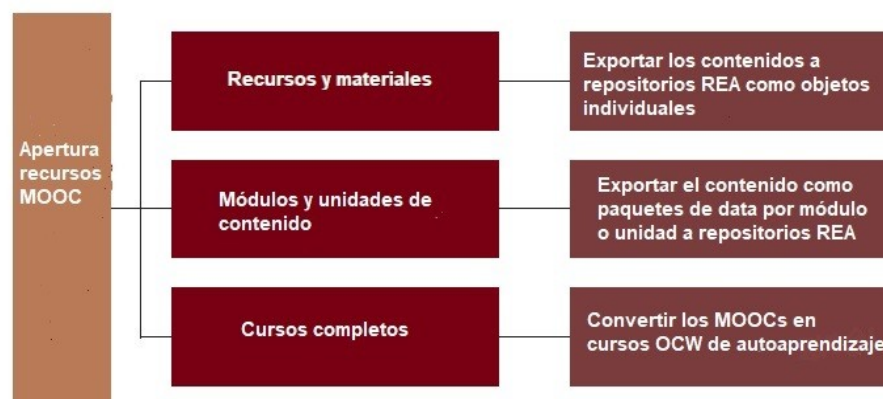
Figura 2. Estrategias para abrir contenidos en MOOCs (Atenas, 2015)

Visto que es posible su transformación, una de las dificultades que se apuntaban anteriormente en cuanto a la utilización de los REA es su rentabilización y uso eficiente. En este sentido, también la literatura presenta diversas posibilidades según los diferentes espacios geográficos. Para Ganapathy, Wei y Jong (2015, p. 62) la elaboración de estos materiales en países asiáticos emergentes ha experimentado un incremento muy considerable por parte de agencias, consorcios u organizaciones privadas. Esto puede repercutir muy favorablemente en la calidad de la educación, pero todavía se encuentran muy infrutilizados con respecto a su auténtico potencial. El trabajo de estos autores ofrece una visión global sobre cuatro países asiáticos (Corea del Sur, Malasia, China e Indonesia) (pp. 63-66) y la utilización de este tipo de recursos por parte de los profesores de inglés.