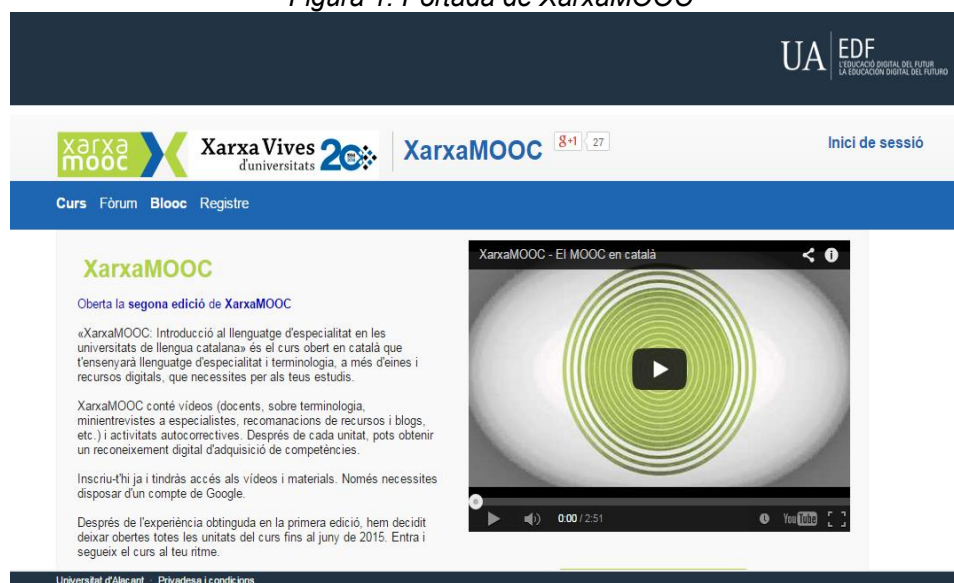
Figura 1. Portada de XarxaMOOC

Desde su primera edición, cuenta con la colaboración de instituciones y asociaciones tanto nacionales como internacionales de renombre: Institut d'Estudis Catalans, Direcció General de Política Lingüística de la Generalitat de Catalunya, TERMCAT, Acadèmia Valenciana de la Llengua,