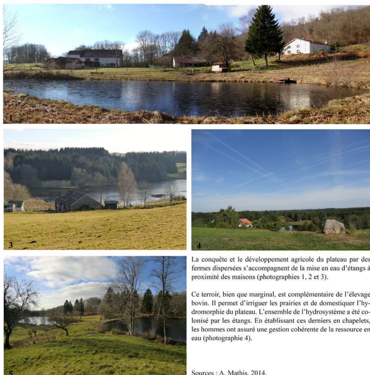
Figure 3. Un paysage de fermes isolées avec son terroir d'étangs.