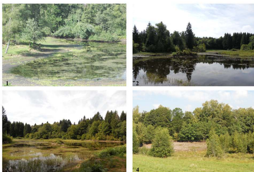
Figure 5. Les paysages d'étangs au sein du cycle de la déprise anthropique

Le terroir des étangs du plateau se révèle particulièrement fragile. La faible profondeur en eau laisse « fleurir » la surface de l'étang et souligne l'origine de l'aménagement d'anciennes tourbières et de zones marécageuses (photographies n°1, 2 et 3). Ces vues illustrent les dynamiques en cours. Ainsi ces étangs, qui sont déjà repris dans un cycle naturel aboutissant à un nouveau stade de type tourbière. La photographie n°4 montre l'abandon d'un étang et l'effacement de la zone humide.