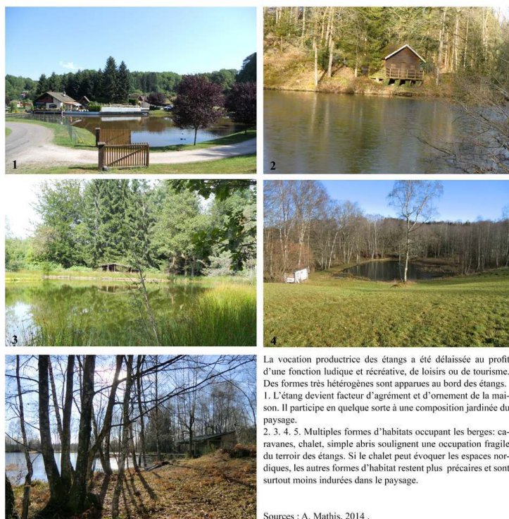
Figure 2. Les nouveaux usages des étangs : des lieux de loisirs individuels