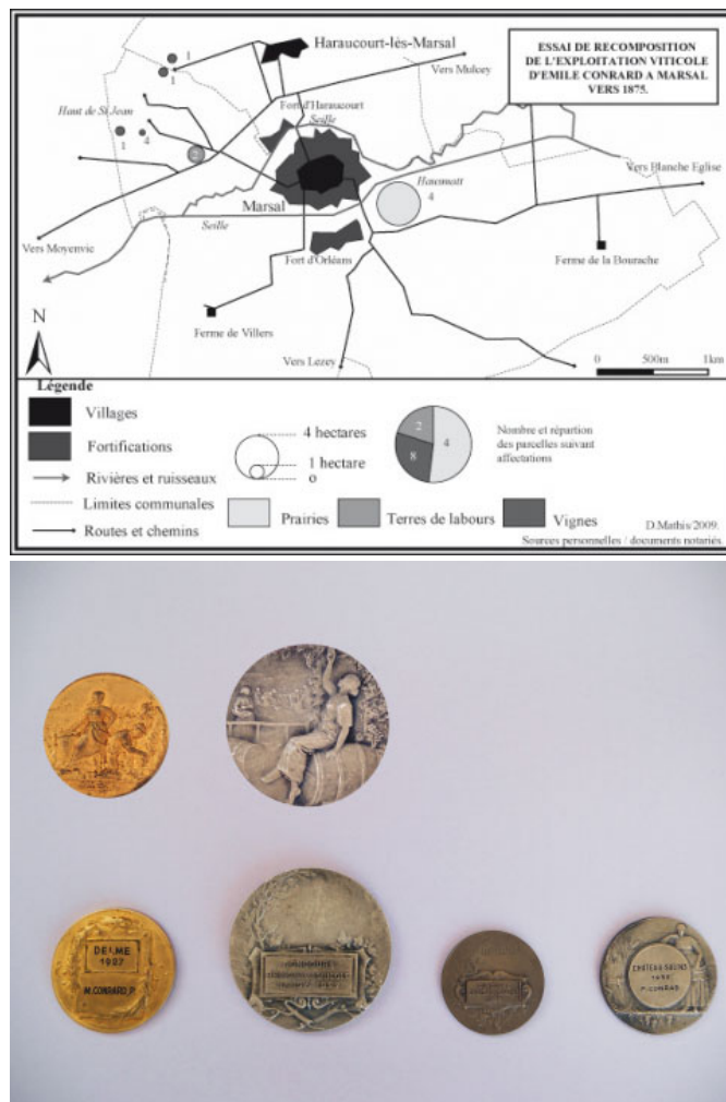
Figures n°3 et n°4 - Une exploitation viticole à Marsal de 1875 à 1940.

les restaurateurs et les associations de commerçants, notamment à Vic-sur-Seille. Toutefois ces méthodes, aujourd'hui pratiquées dans de nombreux vignobles de l'Est de la France, sont sans doute encore trop avant-gardistes dans le contexte de l'entre-deux-guerres pour réussir totalement.