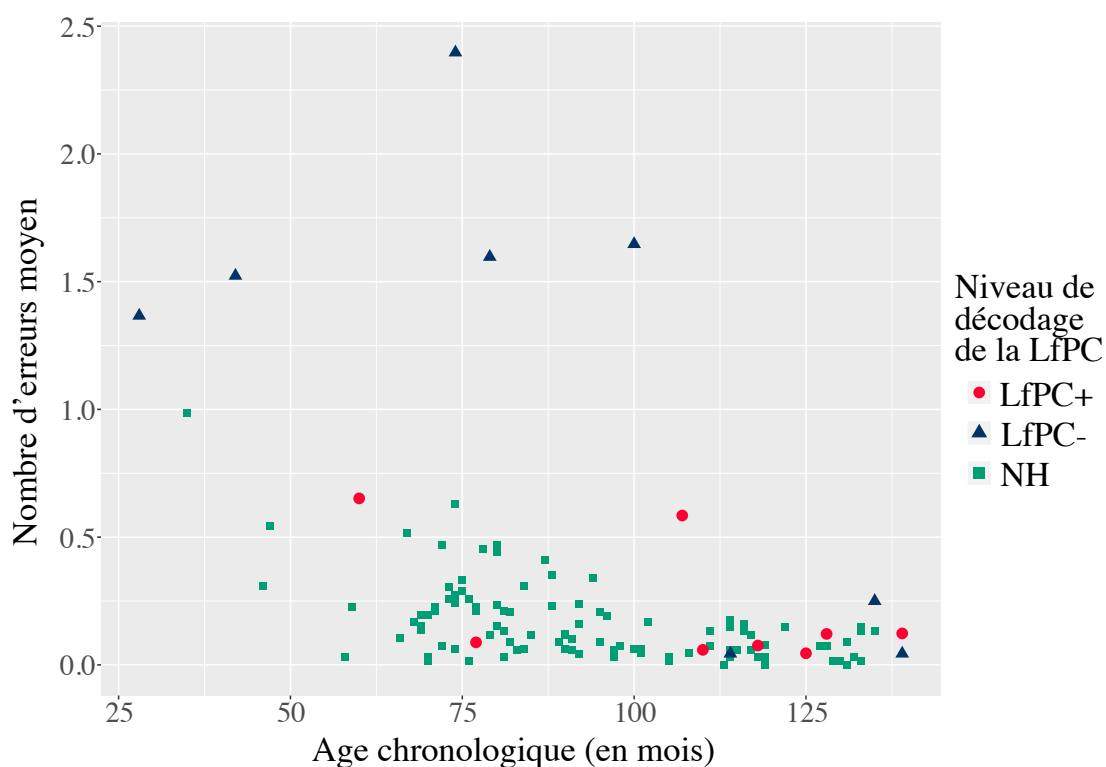
FIGURE 2: Nombre d'erreurs moyen pour les enfants CI et NH en fonction du niveau de décodage de la LfPC et de l'âge chronologique

La figure 2 représente le nombre d'erreurs moyen par mot en fonction du niveau de décodage de la LfPC et de l'âge chronologique pour les enfants des groupes CI et NH. Nous observons que les enfants CI avec un faible niveau de décodage de la LfPC semblent faire plus d'erreurs que les enfants CI avec un bon niveau de décodage de la LfPC, dont les résultats sont plus proches de ceux des enfants NH.