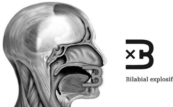
FIGURE 1: Représentation d'un son plosif bilabial avec le système d'écriture Vocal Grammmatics .

utilisés, l'autre sur la manière dont les sons sont produits (plosives, fricatives...). La Figure 1 illustre ce système d'écriture dans le cas d'un son plosif bilabial avec un glyphe morphologique représentant deux lèvres et un glyphe symbolique en forme de croix représentant la plosion.