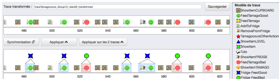
FIG. 2 – Extrait de l'interface de Transmute avec des traces issues d'un jeu sérieux.

Exploration de traces pour la découverte interactive de connaissances. Transmute (Fuchs et Cordier, 2018) est une approche de découverte interactive de connaissances à partir de traces qui s'appuie sur la fouille de données pour mettre en évidence des régularités dans les traces sous la forme de sous-séquences d'événements appelées épisodes séquentiels. L'utilisateur, expert du domaine d'application, est impliqué pour sélectionner des épisodes intéressants et les interpréter pour construire un modèle du phénomène étudié. Les obsels composant la trace sont associés à des représentations choisies par l'utilisateur qui font sens pour lui, des symboles graphiques par exemple, faisant référence à des concepts connus de l'utilisateur (figure 2). Les épisodes sont représentés de la même façon et localisés dans la trace pour améliorer leur compréhension en contexte. Le système à base de traces fournit des possibilités de transformations dont la réécriture qui crée, à partir des épisodes sélectionnés, une nouvelle trace d'un niveau plus abstrait associé à son modèle. Le modèle du phénomène étudié qui a été construit à l'issue de l'interprétation est explicable car il est possible de naviguer vers ses éléments constitutifs dans la trace dont il est issu, et ceci de manière récursive.