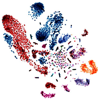
FIGURE 3 – Résultat de l'algorithme t-SNE sur les vecteurs SkipRel + Connecteur pour les relations explicites de niveau 2