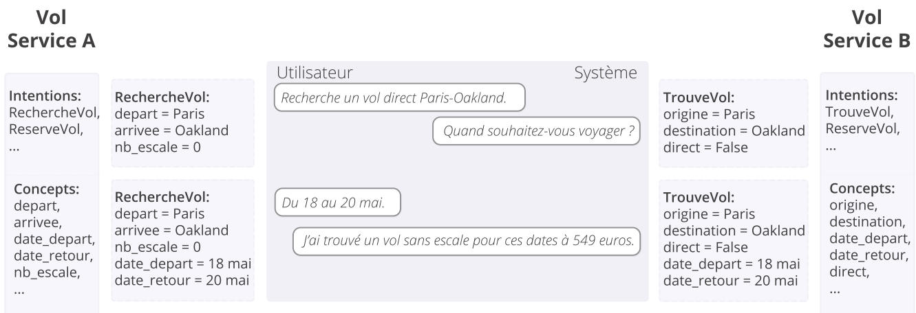
FIGURE 2 – États du dialogue conditionnés par les schémas correspondant à deux services similaires de réservations de vols. Figure adaptée en français de Rastogi et al. (2019) .

La figure 2 illustre la manière dont les annotations correspondants à deux schémas de services similaires de réservation de vols conditionnent les états et créent des chevauchements. D’un côté l’intention RechercheVol et le concept depart du service A ainsi que l’intention TrouveVol et le concept origine du service B se correspondent. De l’autre l’intention ReserveVol et le concept date_retour se retrouvent dans les deux services.