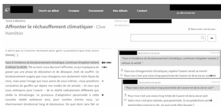
FIGURE 1 – Interface d'AREN : texte débattu à gauche, commentaires à droite découpés en 3 parties : sélection (extrait à commenter), reformulation (de la sélection), argumentation (où on s'exprime).

L'idée soutenant notre méthode est de créer des vecteurs pour chaque contribution textuelle, d'enrichir ceux-ci via le réseau lexico-sémantique et de les comparer par un produit scalaire. Il est ainsi possible de déterminer automatiquement quelles contributions sont proches thématiquement les unes des autres, et ce même si le vocabulaire utilisé diverge.