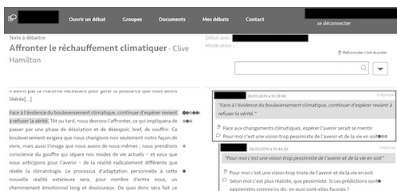
FIGURE 1 – Interface d'AREN : texte débattu à gauche, commentaires à droite découpés en 3 parties : sélection (extrait à commenter), reformulation (de la sélection), argumentation (où on s'exprime).

L'idée soutenant notre méthode est de créer des vecteurs pour chaque contribution textuelle, d'enrichir ceux-ci via le réseau lexico-sémantique et de les comparer par un produit scalaire. Il est ainsi possible de déterminer automatiquement quelles contributions sont proches thématiquement les unes des autres, et ce même si le vocabulaire utilisé diverge.