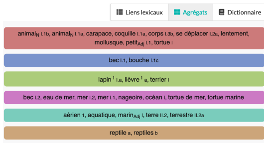
FIGURE 2 – Agrégats sémantiques dans le voisinage de TORTUE I et TORTUE II

et al. , 2009) est également disponible. On observe bien souvent que des agrégats incohérents rendent compte de descriptions insuffisantes ou de liens erronés dans la ressource.