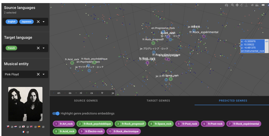
FIGURE 2 – Prédiction des genres musicaux de Pink Floyd en Français. Les prédictions représentées en vert coïncident avec les annotations de genres de Pink Floyd en Français au sein de DBpedia.