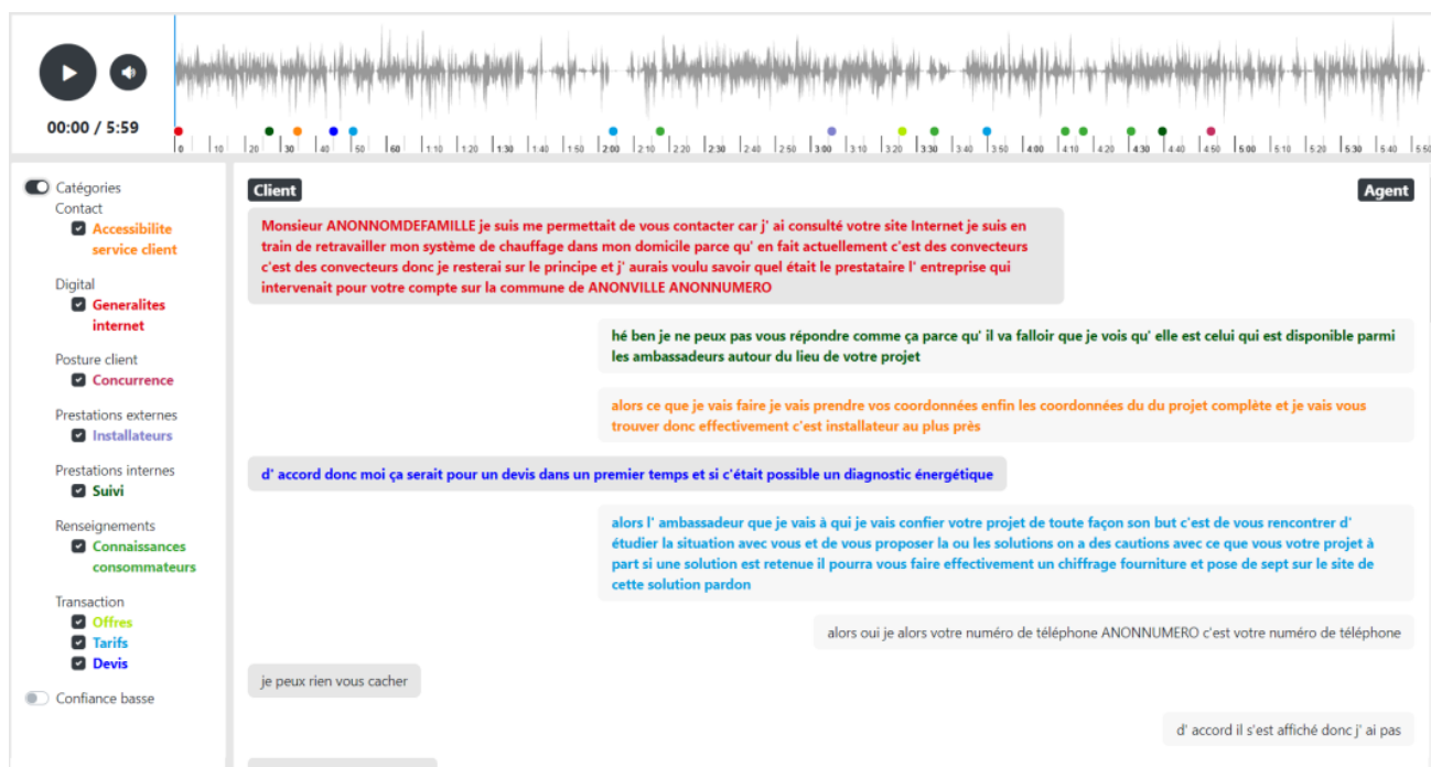
FIGURE 2 : illustration du prototype du lecteur audio synchronisé avec la transcription analysée. Les pastilles colorées et la coloration des énoncés représentent les catégories attribuées aux énoncés et leurs occurrences dans la conversation. Actuellement cet affichage n'illustre pas la détection des opinions, ni l'aspect multi-label de la catégorisation.

La Figure 2 ci-dessous illustre un prototype d'affichage des conversations transcrites et analysées.