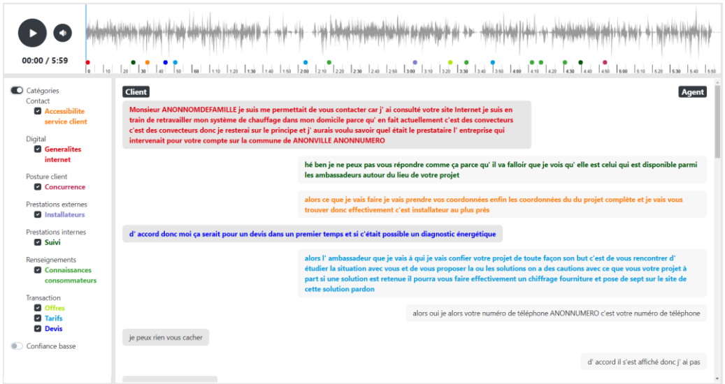
FIGURE 2 : illustration du prototype du lecteur audio synchronisé avec la transcription analysée. Les pastilles colorées et la coloration des énoncés représentent les catégories attribuées aux énoncés et leurs occurrences dans la conversation. Actuellement cet affichage n'illustre pas la détection des opinions, ni l'aspect multi-label de la catégorisation.

La Figure 2 ci-dessous illustre un prototype d'affichage des conversations transcrites et analysées.