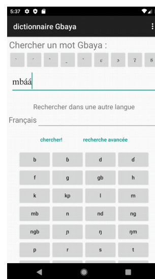
Figure 1: Page principale