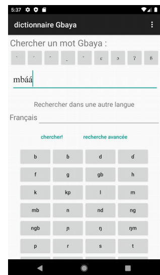
Figure 1: Page principale