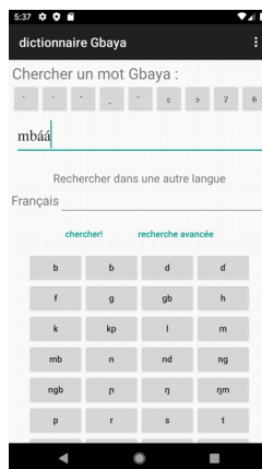
Figure 1: Page principale